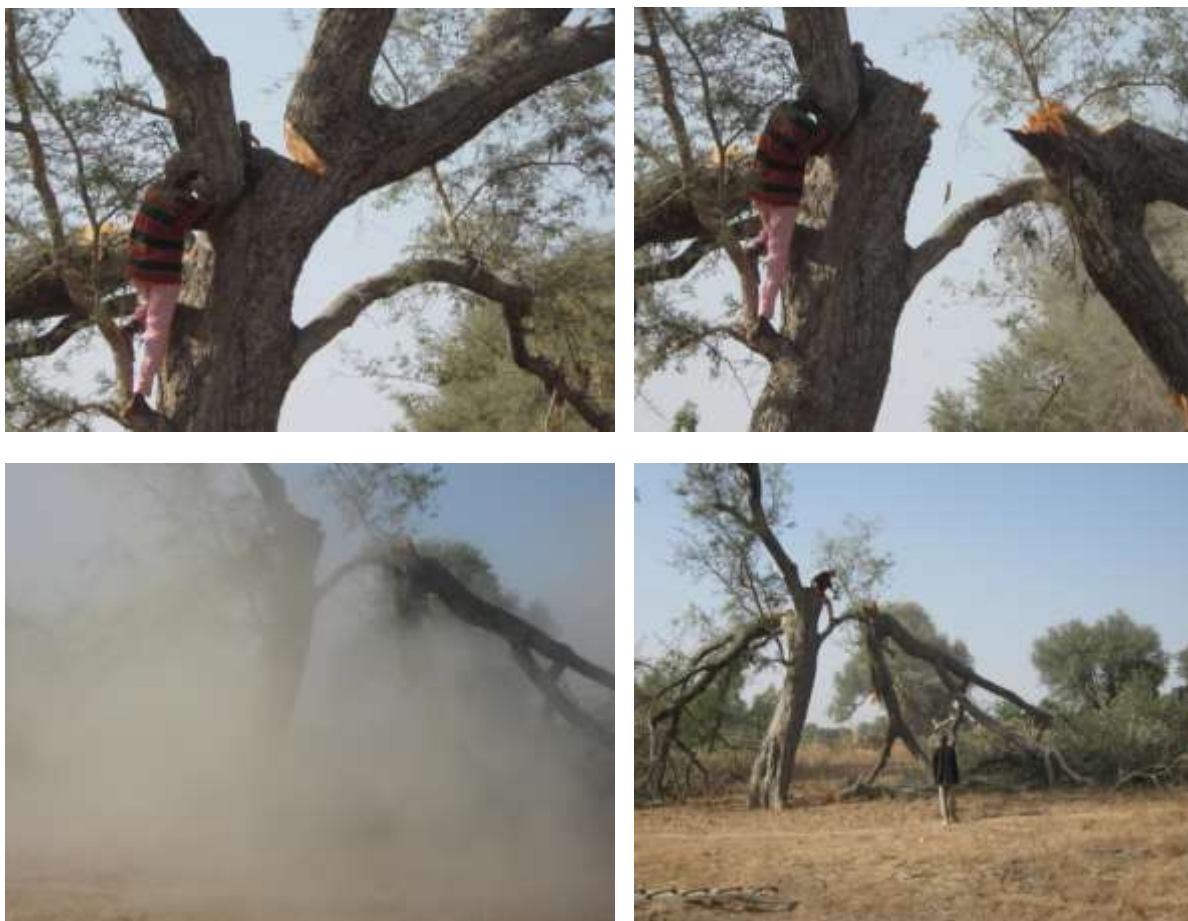
Photo1 : La coupe d'un vieux Feidherbia et les effets destructeurs sur l'environnement