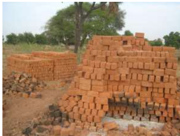
Photo7 : fabrication des briques de terre cuite