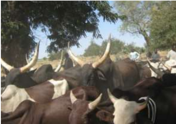
Photo6 : Exploitation d'élevage bovin à Datchéka

éleveurs, elle n'est pas arrivée à développer suffisamment cette activité de manière à la rendre plus lucrative. Les épizooties restent une contrainte qui pénalise le développement de l'élevage. Il existe un seul poste vétérinaire situé à Datchéka ne permettant pas un bon suivi des élevages. Les différents diagnostics dans ce domaine ne se font pas à temps. Parfois, quand un cas se déclare il est pratiquement tard de recourir à une intervention. L'explosion démographique conjuguée à une augmentation continue des cheptels posent un problème d'insuffisance des pâturages. La recherche des solutions devrait prioriser la révision des systèmes d'élevages. Les agro éleveurs devront trouver une alternative au système pastoral extensif.