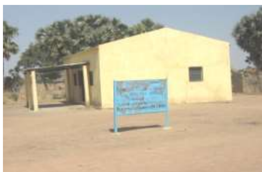
Photo10 : Délégation du MINEPIA de Datchéka

Le service de l'élevage est un bâtiment qui abrite le bureau du chef de centre. Il est assez vieux cependant nouvellement restauré et permet aux agents vétérinaires de travailler. Ce service couvre l'Arrondissement et met en œuvre les actions liées au suivi du soin de santé animale.