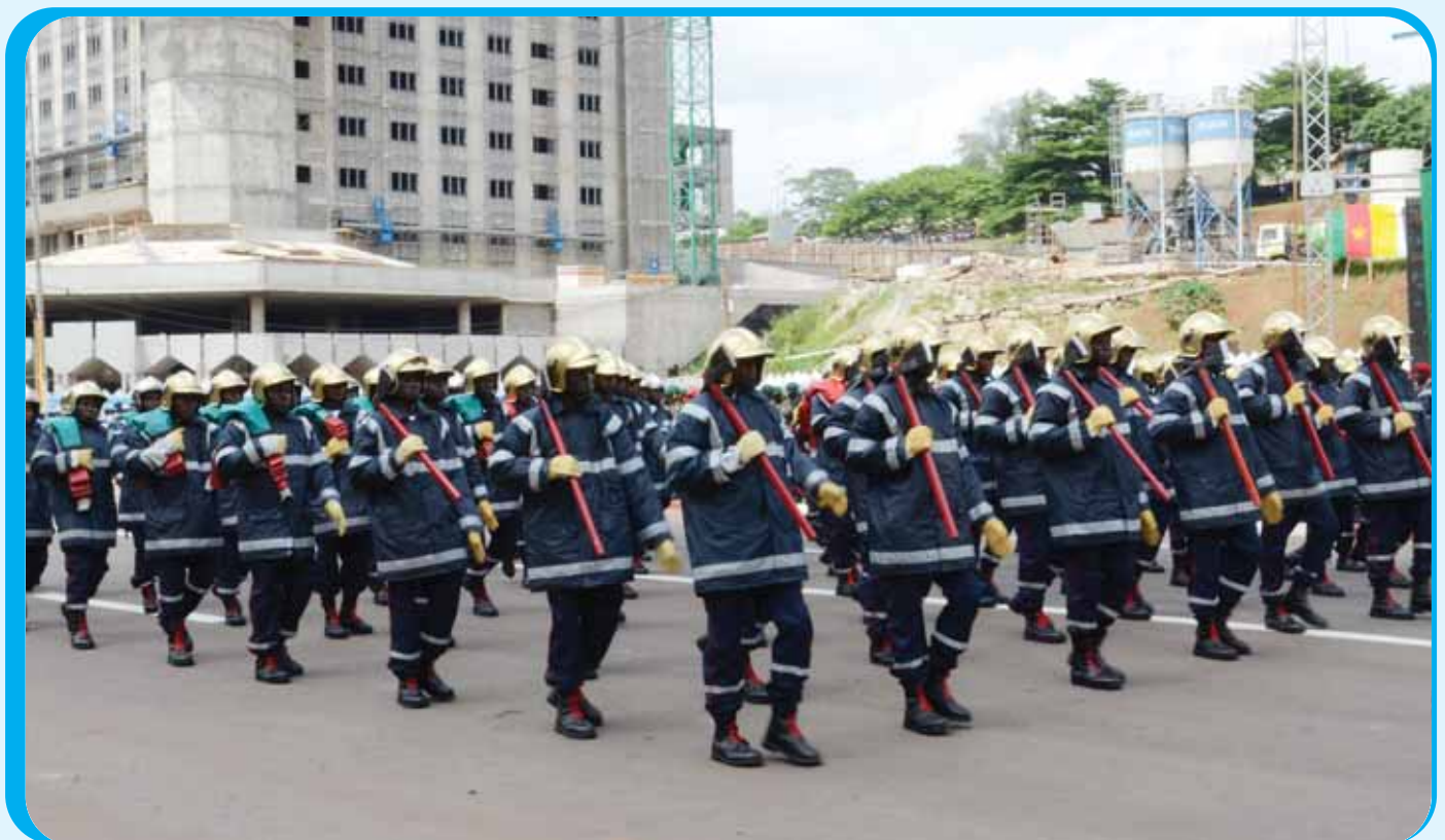
The Fire Fighters Brigade were outstanding because of their outfits.