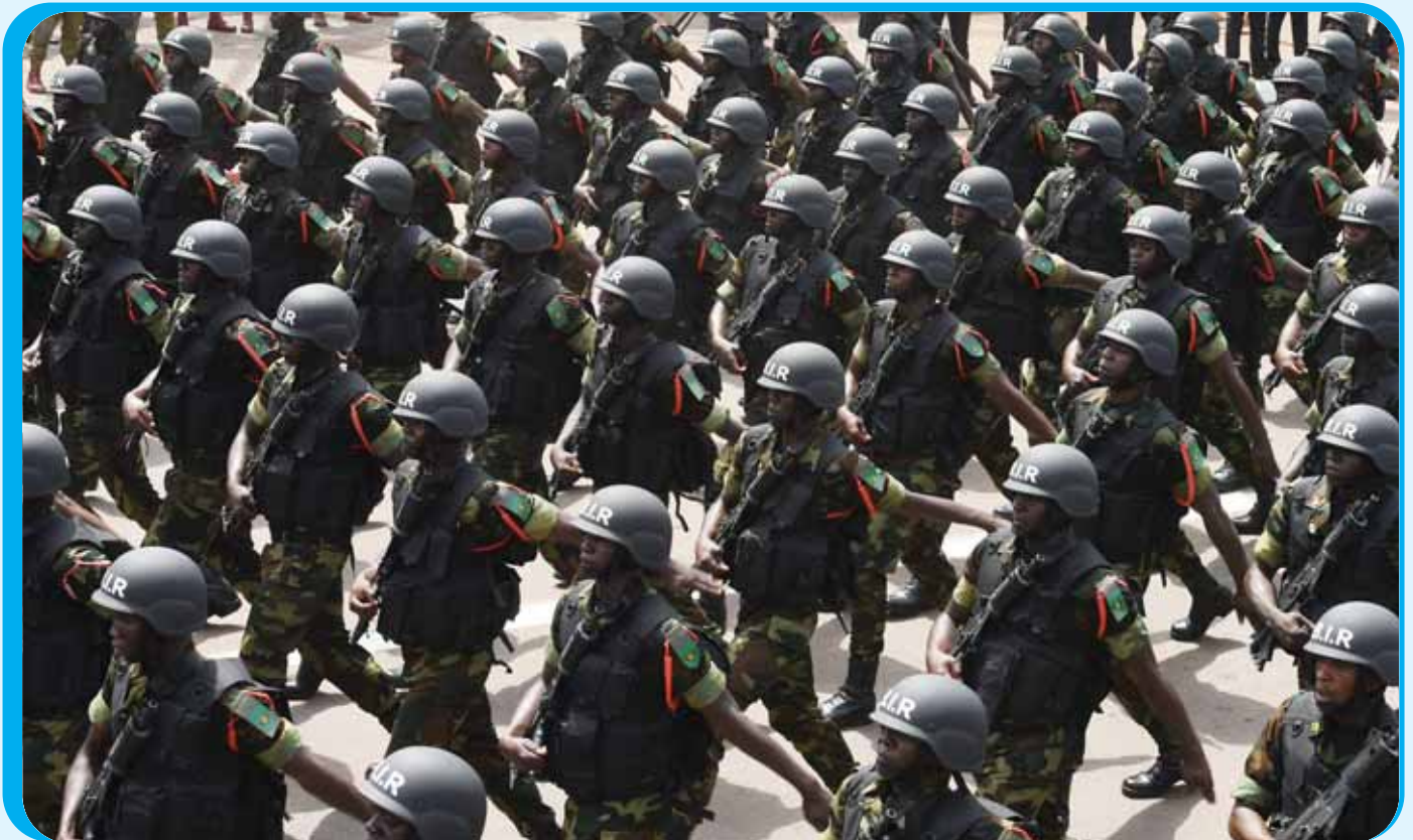
Les éléments du BIR ont démontré leur savoir-faire dans la guerre contre Boko Haram et les autres bandes armées étrangères aux côtés d'autres forces.