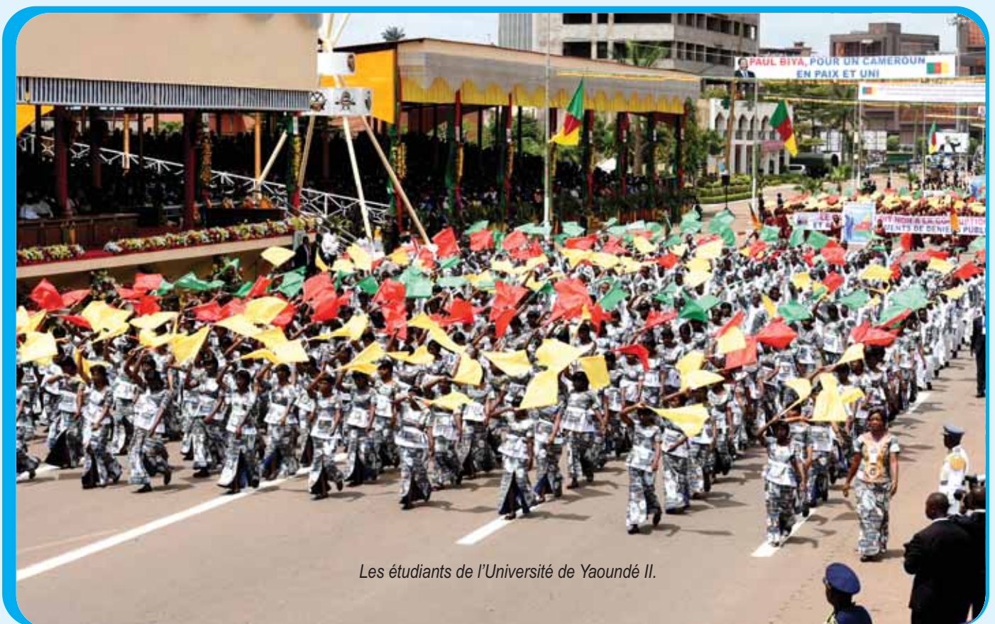
Les étudiants de l'Université de Yaoundé II.