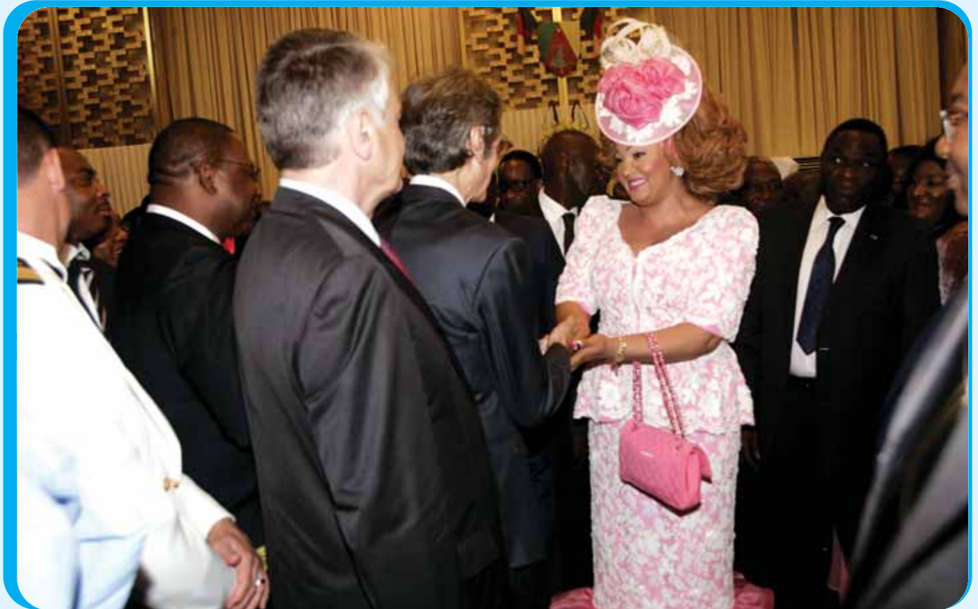
The First Lady with some members of the Diplomatic Corps.