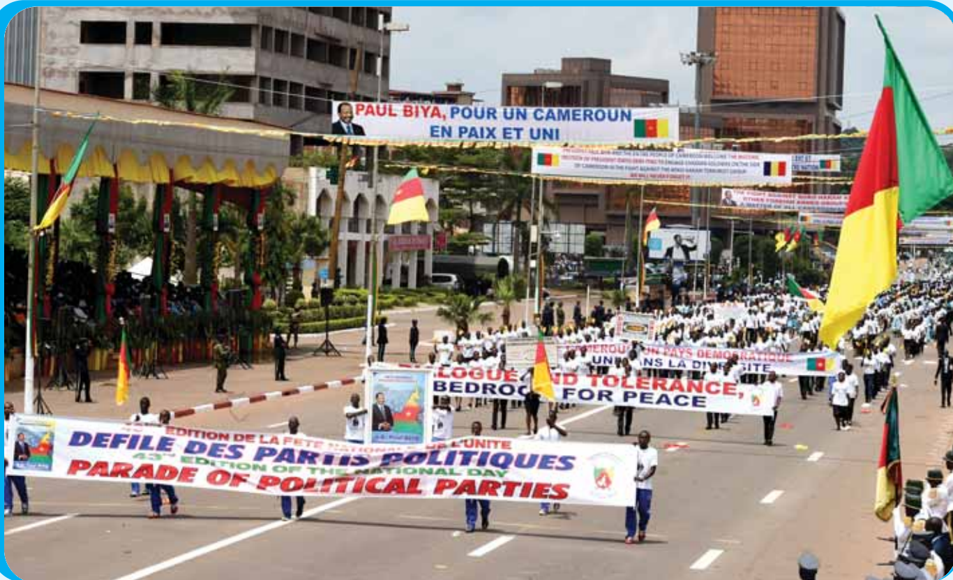
La mobilisation des partis politiques, expression d'un Cameroun démocratique et jaloux de son unité.