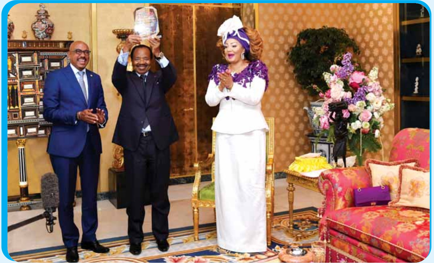
A travers la nomination de Mme Chantal BIYA comme Ambassadrice Spéciale de l'ONUSIDA, c'est le Cameroun qui est honoré.