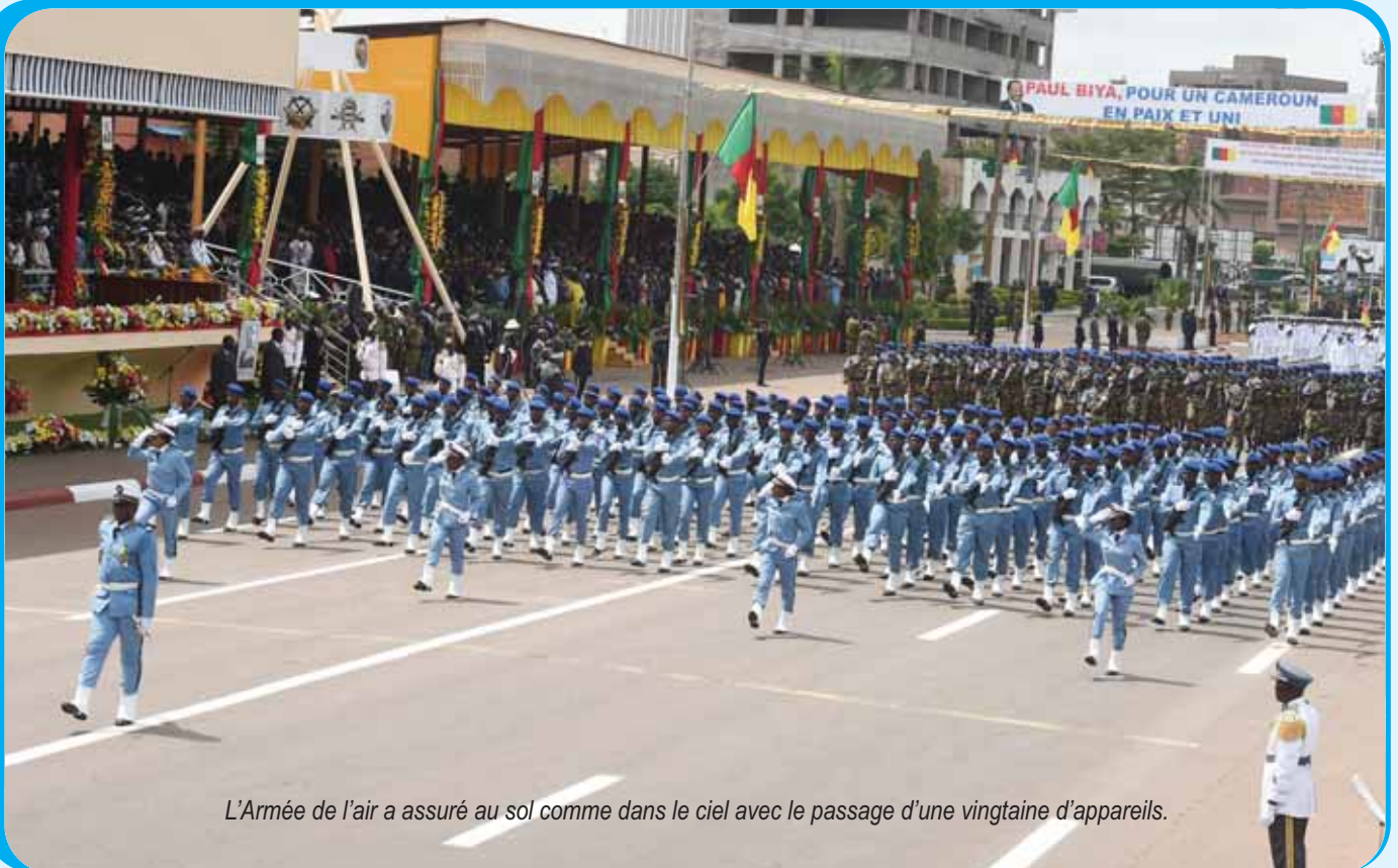
L'Armée de l'air a assuré au sol comme dans le ciel avec le passage d'une vingtaine d'appareils.