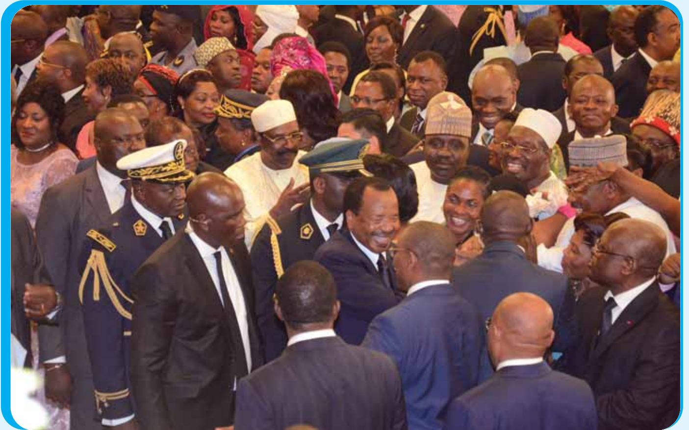
Intimate moments for invitees and the Presidential Couple.