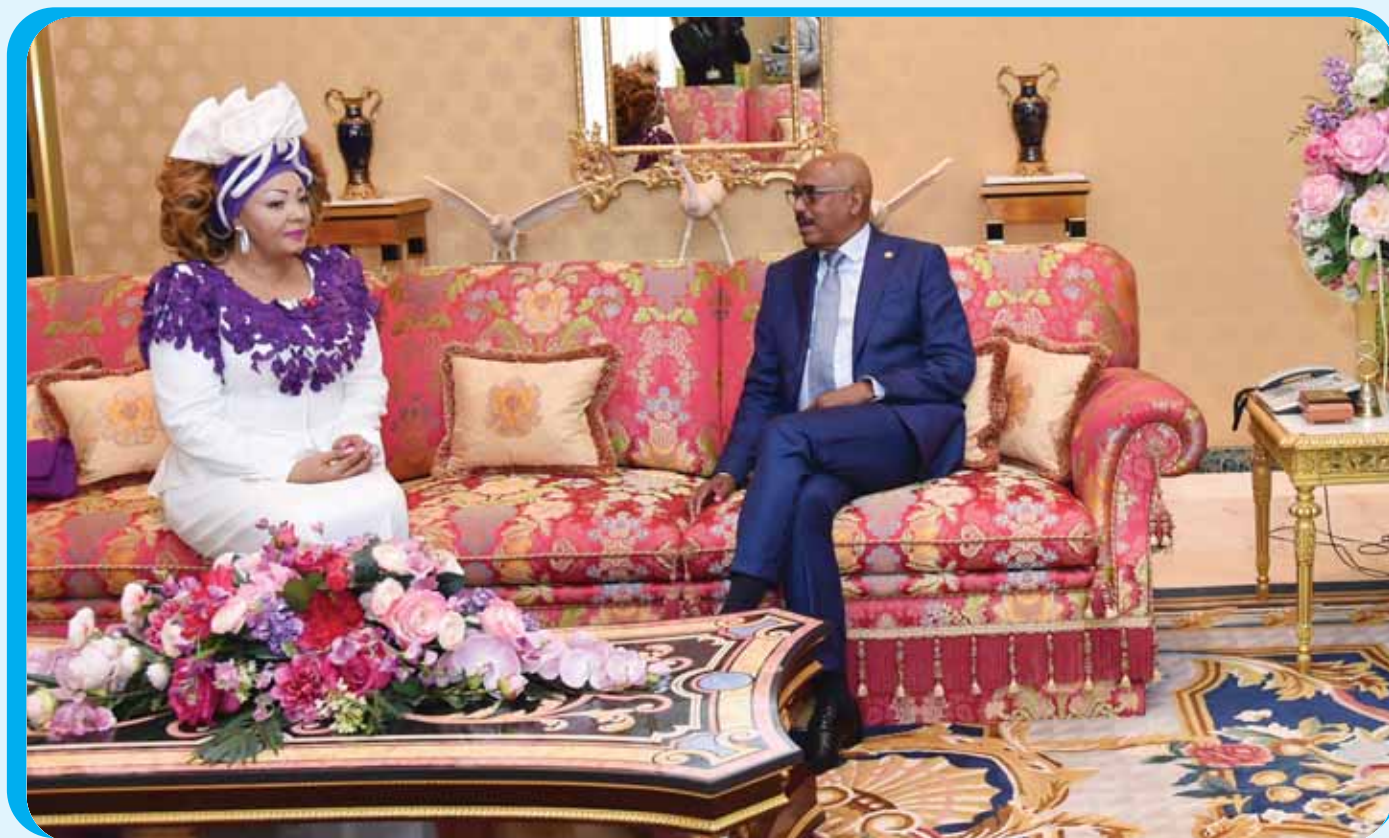
L'Ambassadrice Spéciale de l'ONUSIDA recevant sa feuille de route.