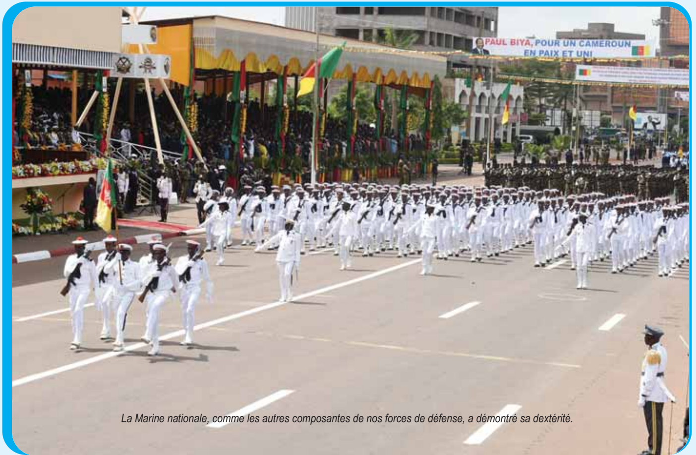
La Marine nationale, comme les autres composantes de nos forces de défense, a démontré sa dextérité.