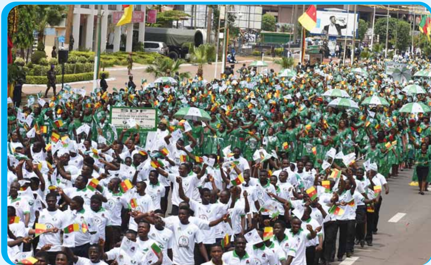
The leading opposition party, the Social Democratic Front and other political parties came out in numbers to grace the occasion.