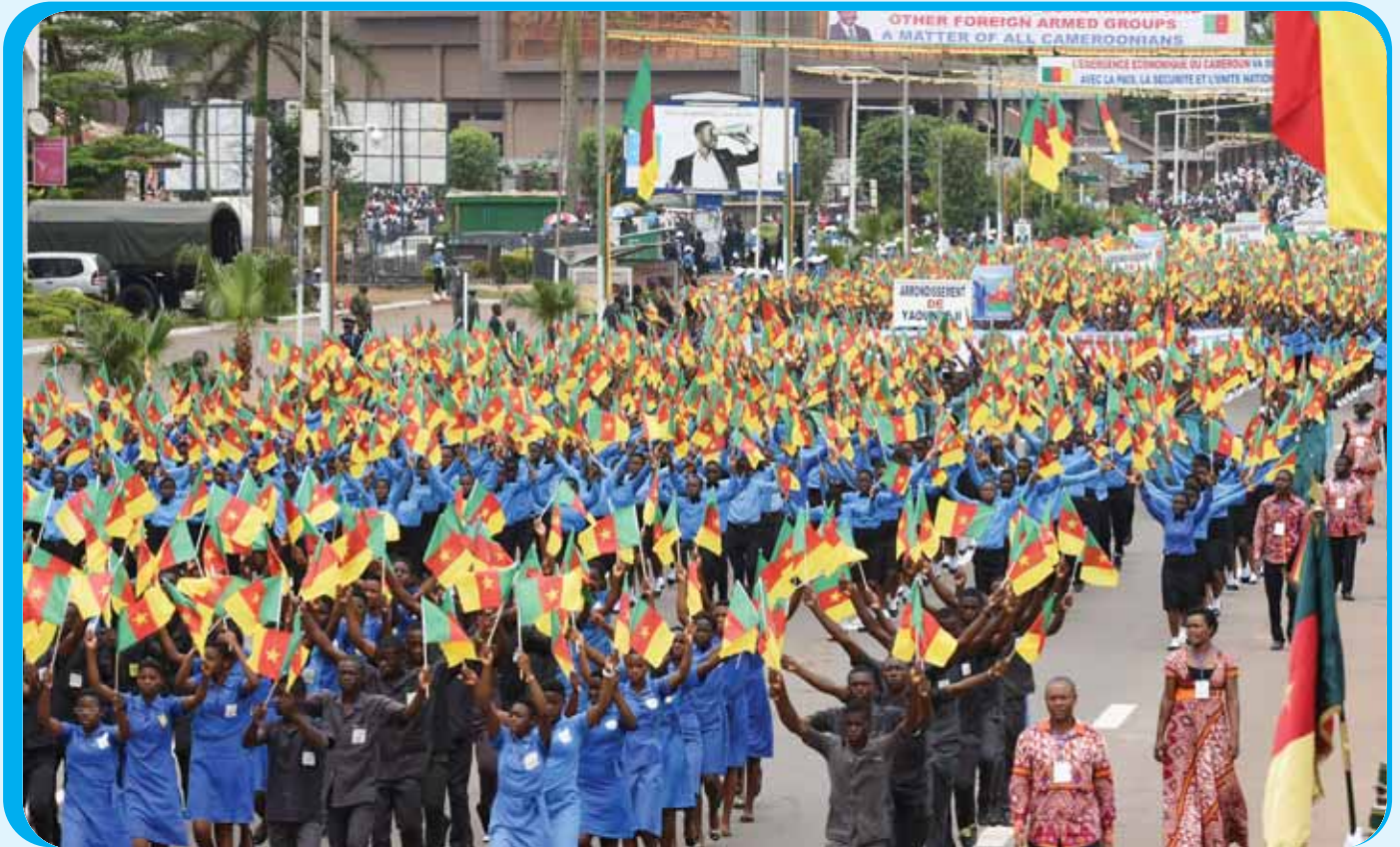
J'aime mon beau pays le Cameroun.