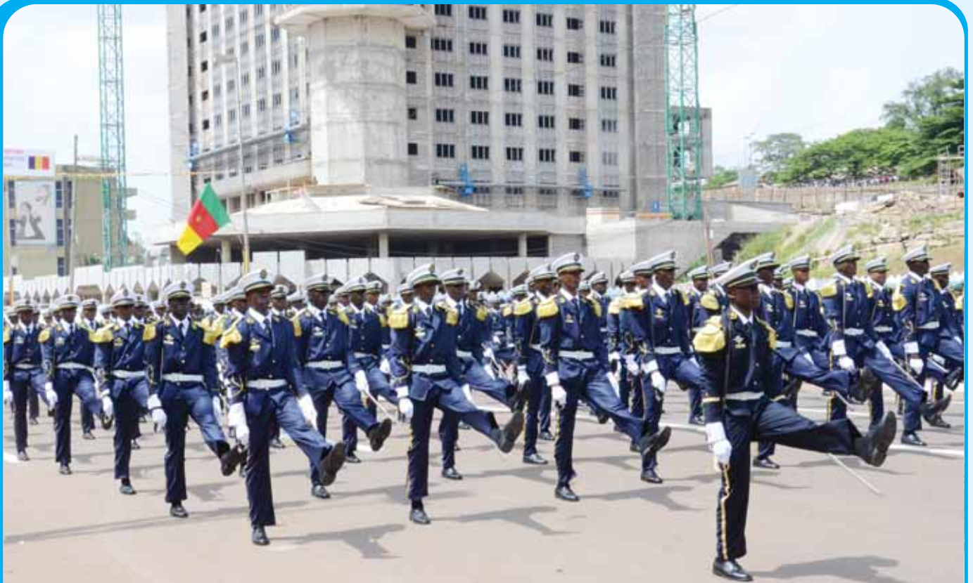
Cadet Officers of the Combined Military Academy, a nursery of the future senior officers.