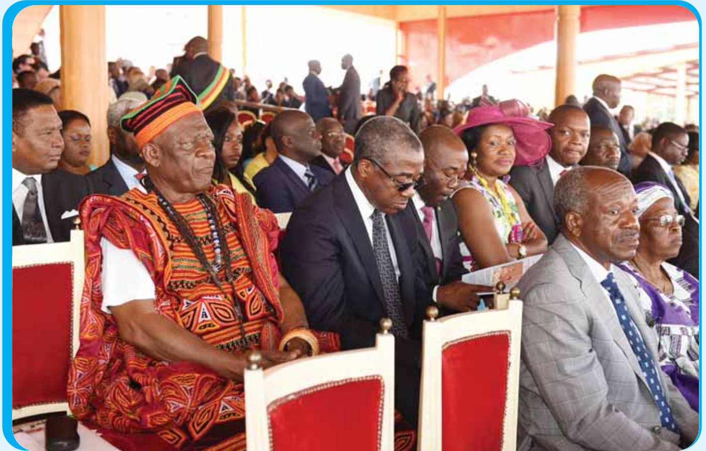
The leader of the SDF Mr. John FRU NDI was present to cheer up militants of his party as they had an impressive march past in Yaoundé.