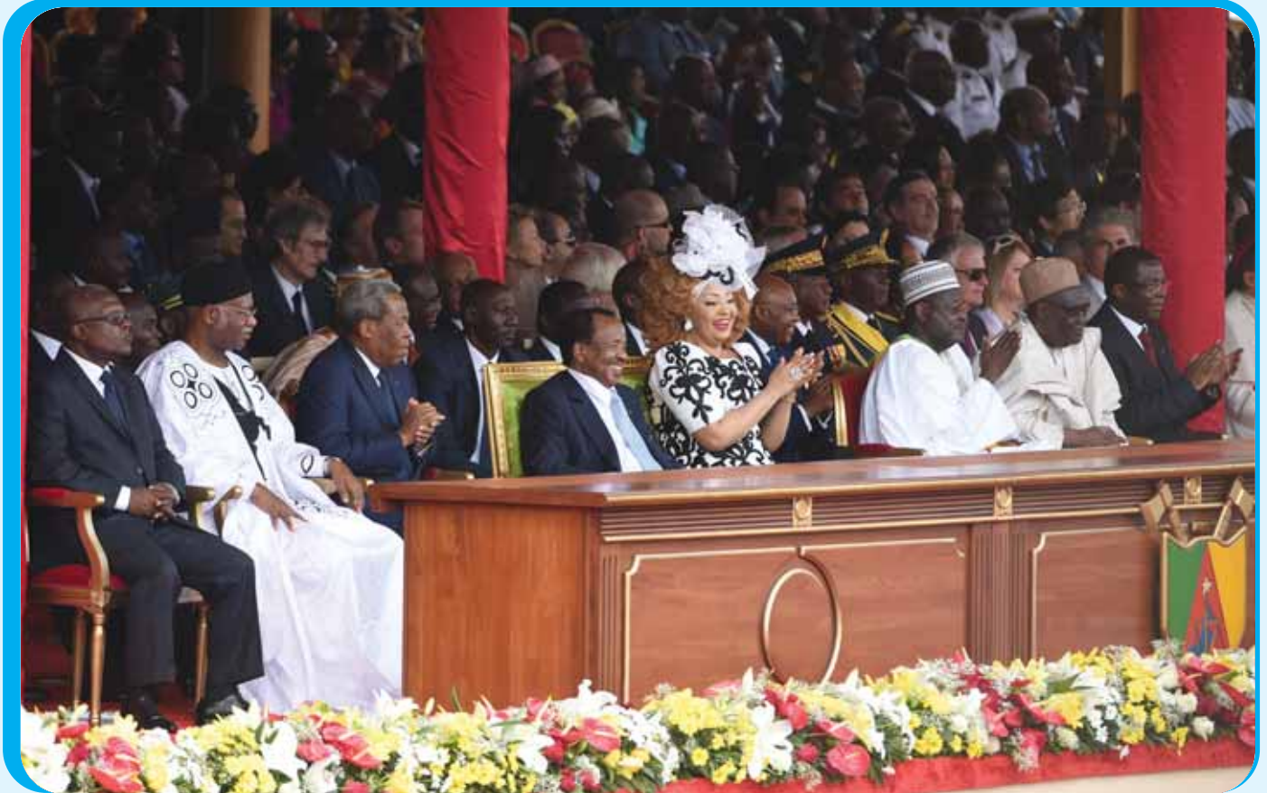
Le défilé civil, un spectacle captivant.