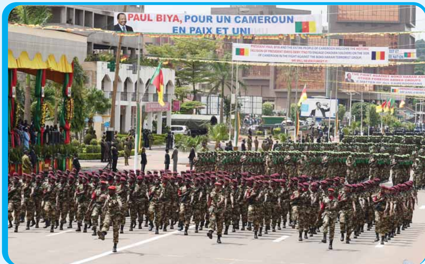
Les éléments du Bataillon des troupes aéroportées et ceux du Bataillon spéciale amphibie font aussi preuve de leur habileté dans la lutte contre Boko Haram et la piraterie maritime.