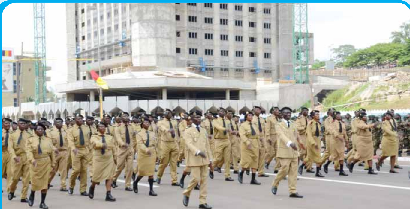
Anciens combattants et militaires, le souvenir du rôle joué dans la préservation de la paix et de l'intégrité du territoire.