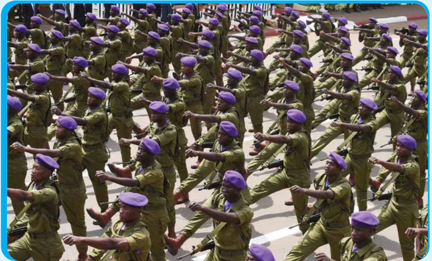
. Order and discipline: the Republican Guard.