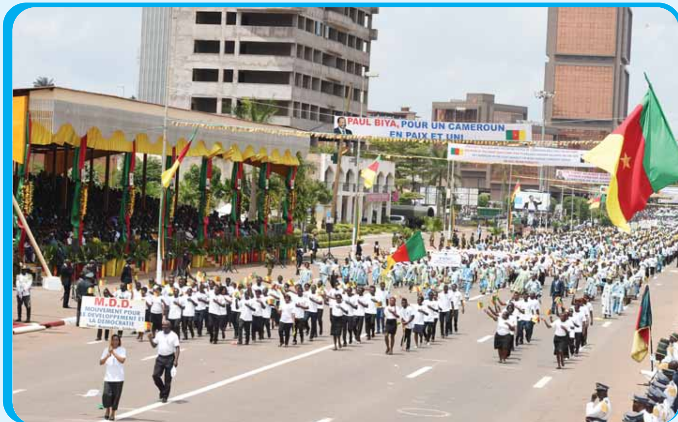
The MDD and ANDP made their presence felt with scores of party militants.