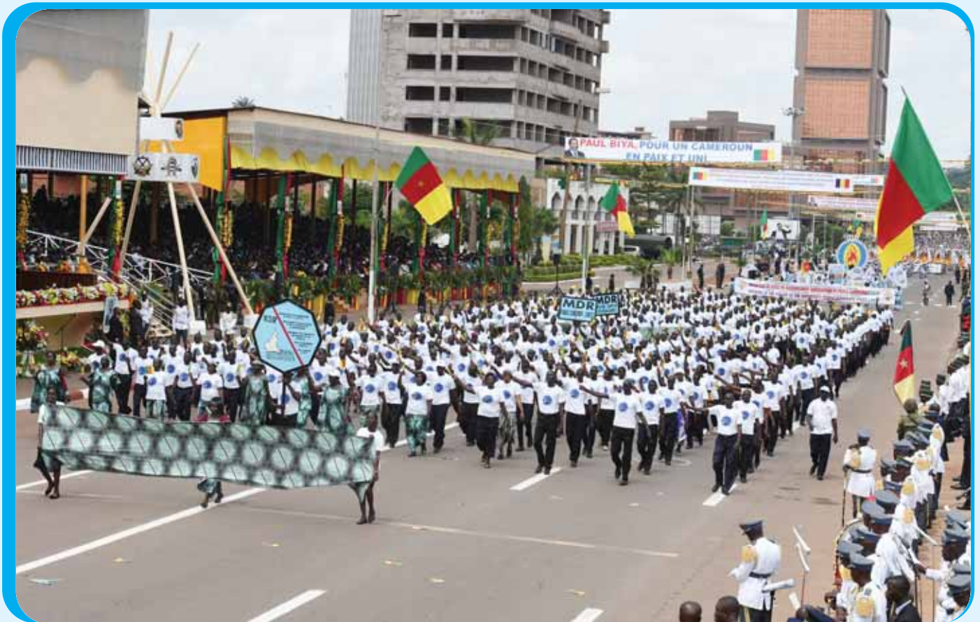
The MDR and CDU, parties represented in Parliament were also part of the march past.