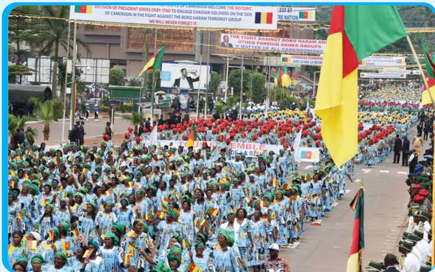
The Women and Youth wings of the CPDM were very colourful in their outfits and uniforms.