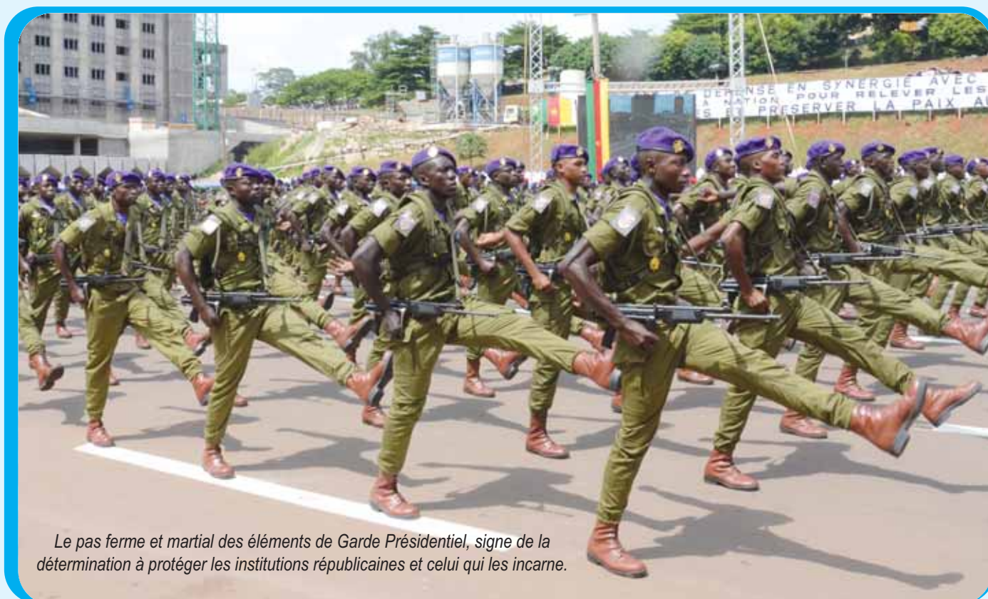
Le pas ferme et martial des éléments de Garde Présidentiel, signe de la détermination à protéger les institutions républicaines et celui qui les incarne.