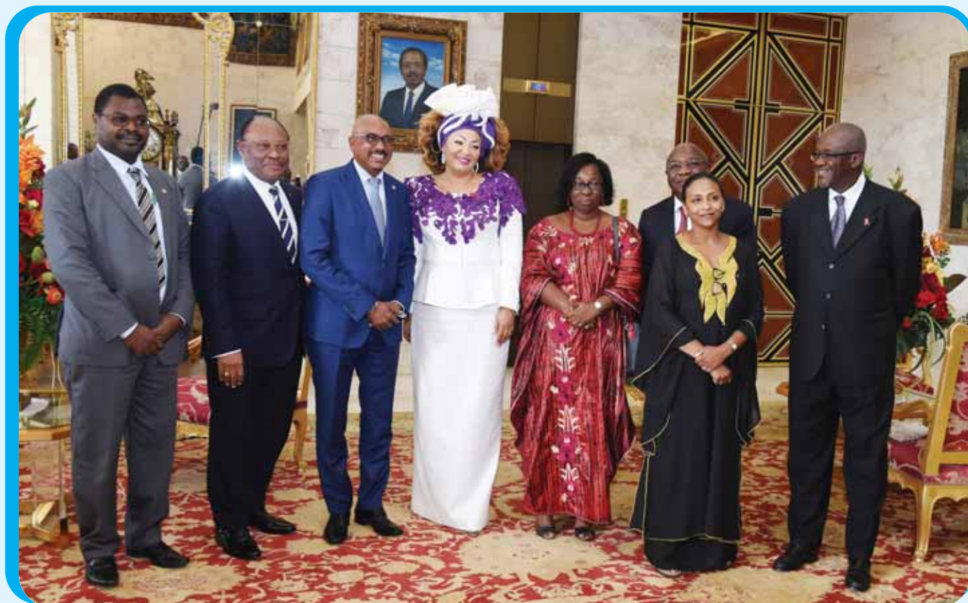
La délégation de l'ONUSIDA fière d'accueillir une pionnière dans la lutte contre le VIH/SIDA.