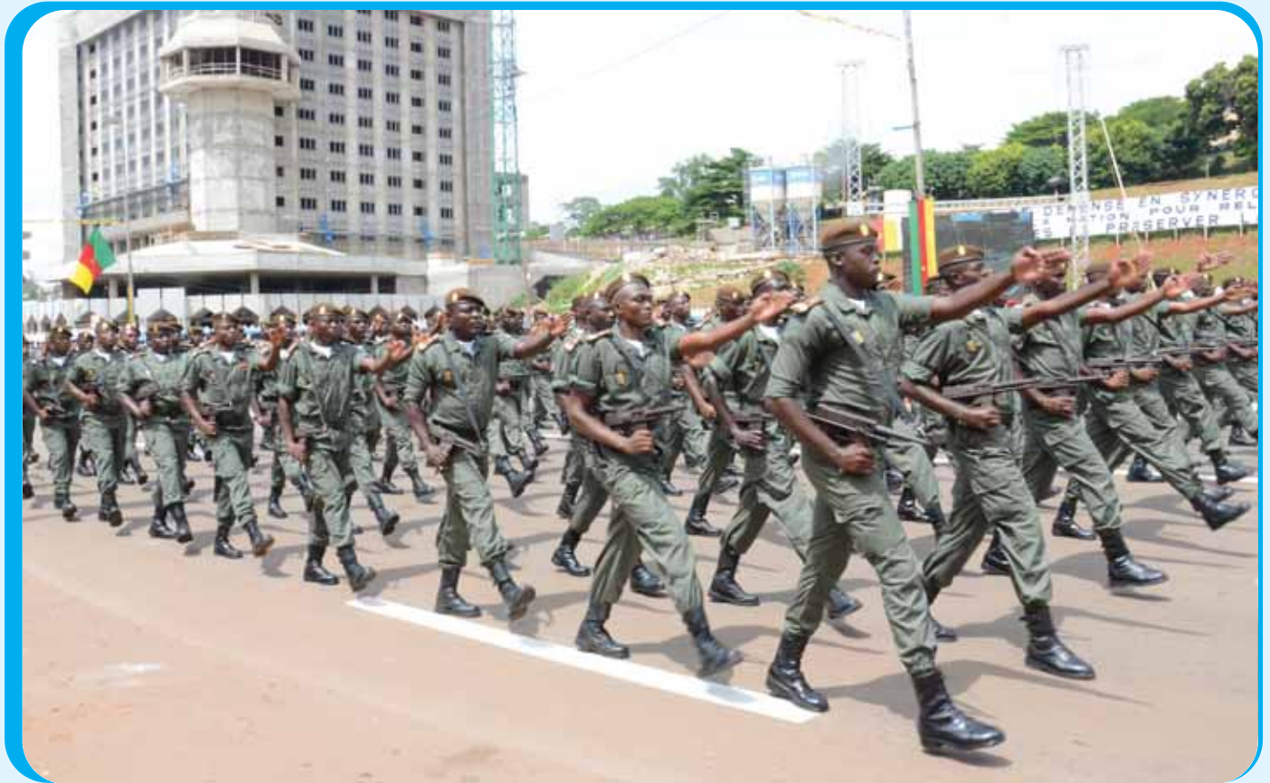
Les éléments de l'Administration pénitentiaire ont joué leur partition comme d'habitude.