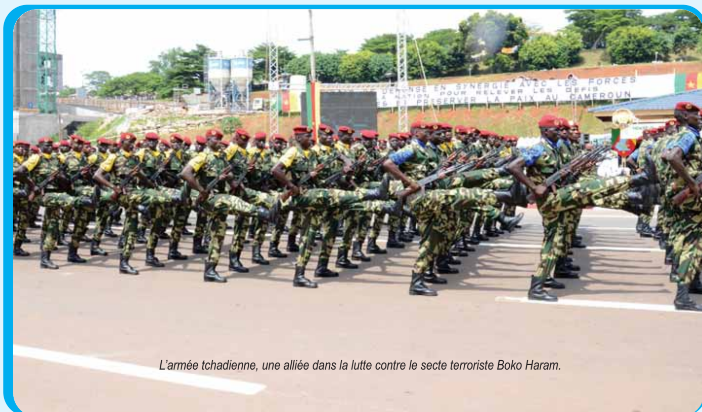
L'armée tchadienne, une alliée dans la lutte contre le secte terroriste Boko Haram.