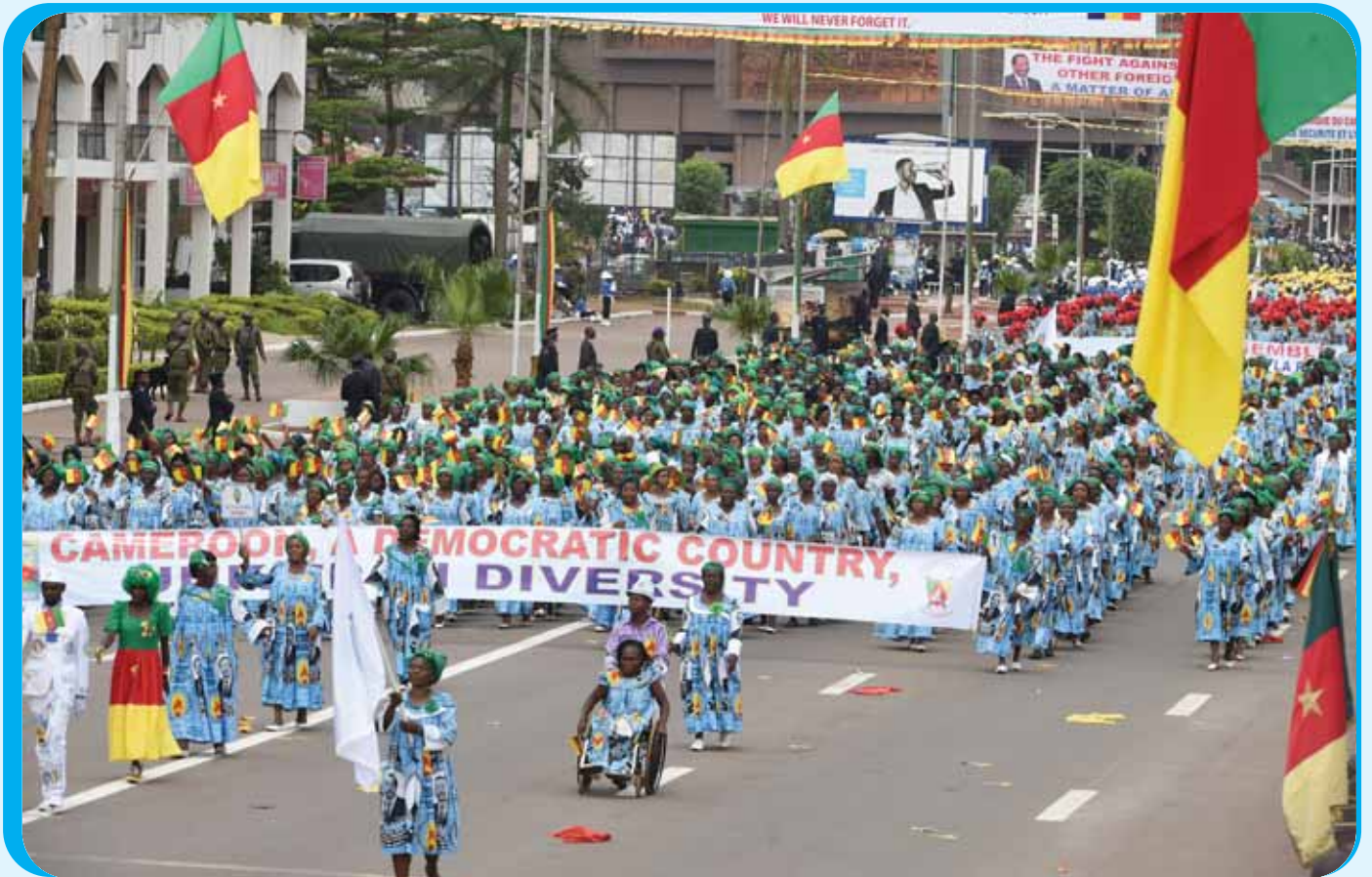
The CPDM machine had an endless flow of militants.