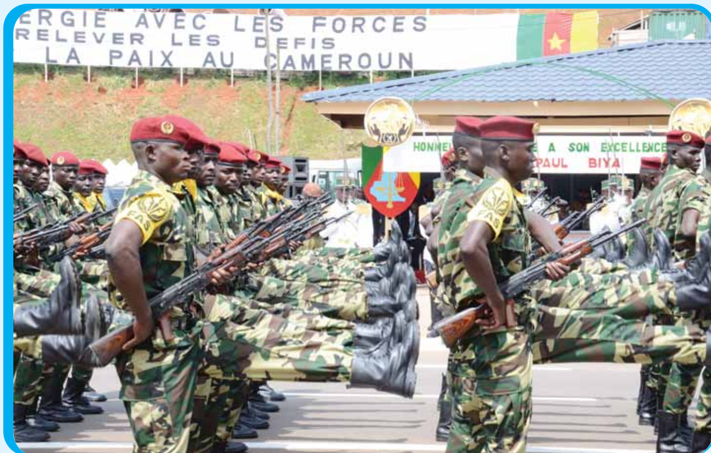
Le pas de l'oie exécuté magistralement par les soldats tchadiens. Ils ont été très applaudis par le Chef des Armées, S. E. Paul BIYA et l'ensemble du public