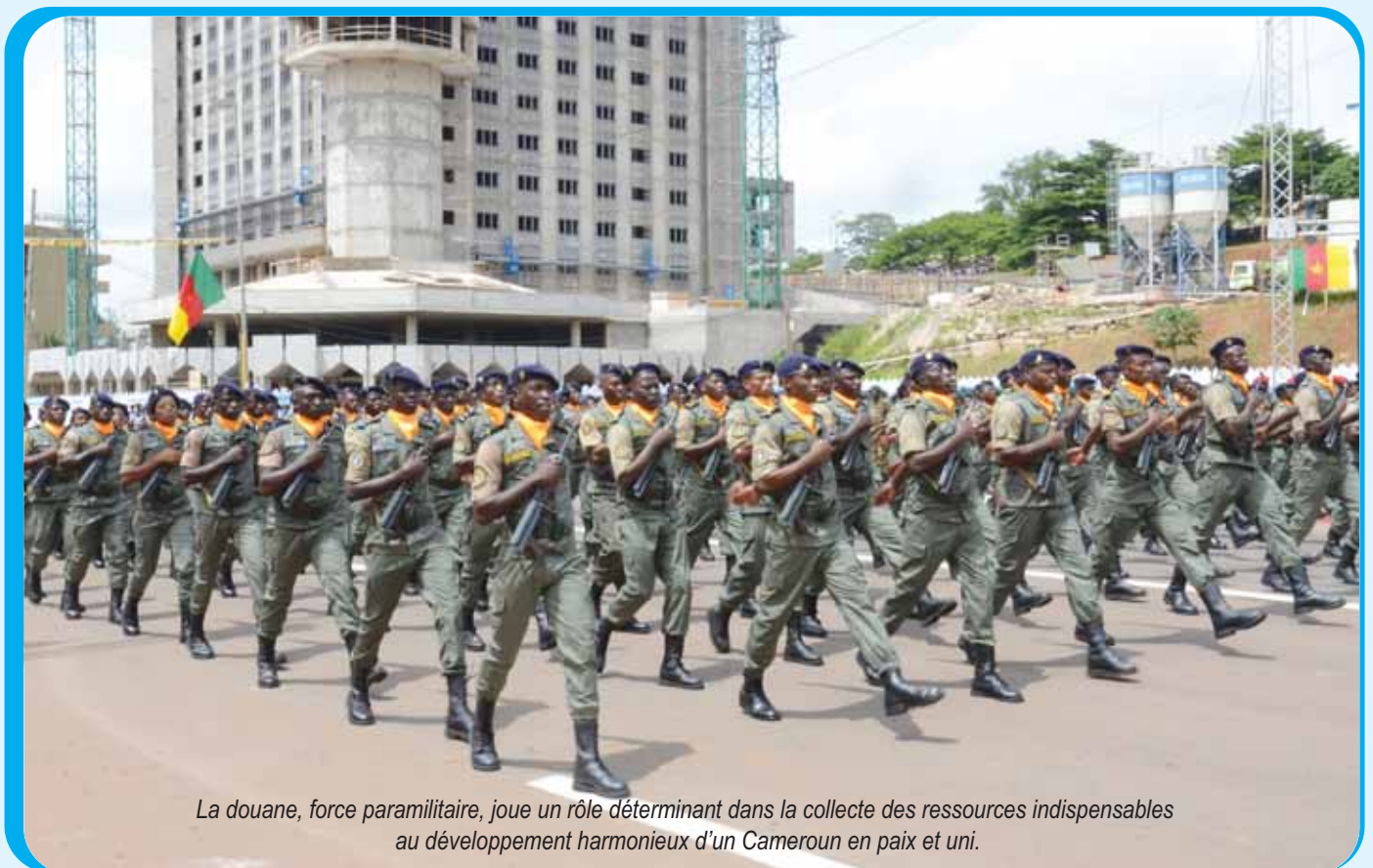
La douane, force paramilitaire, joue un rôle déterminant dans la collecte des ressources indispensables au développement harmonieux d'un Cameroun en paix et uni.