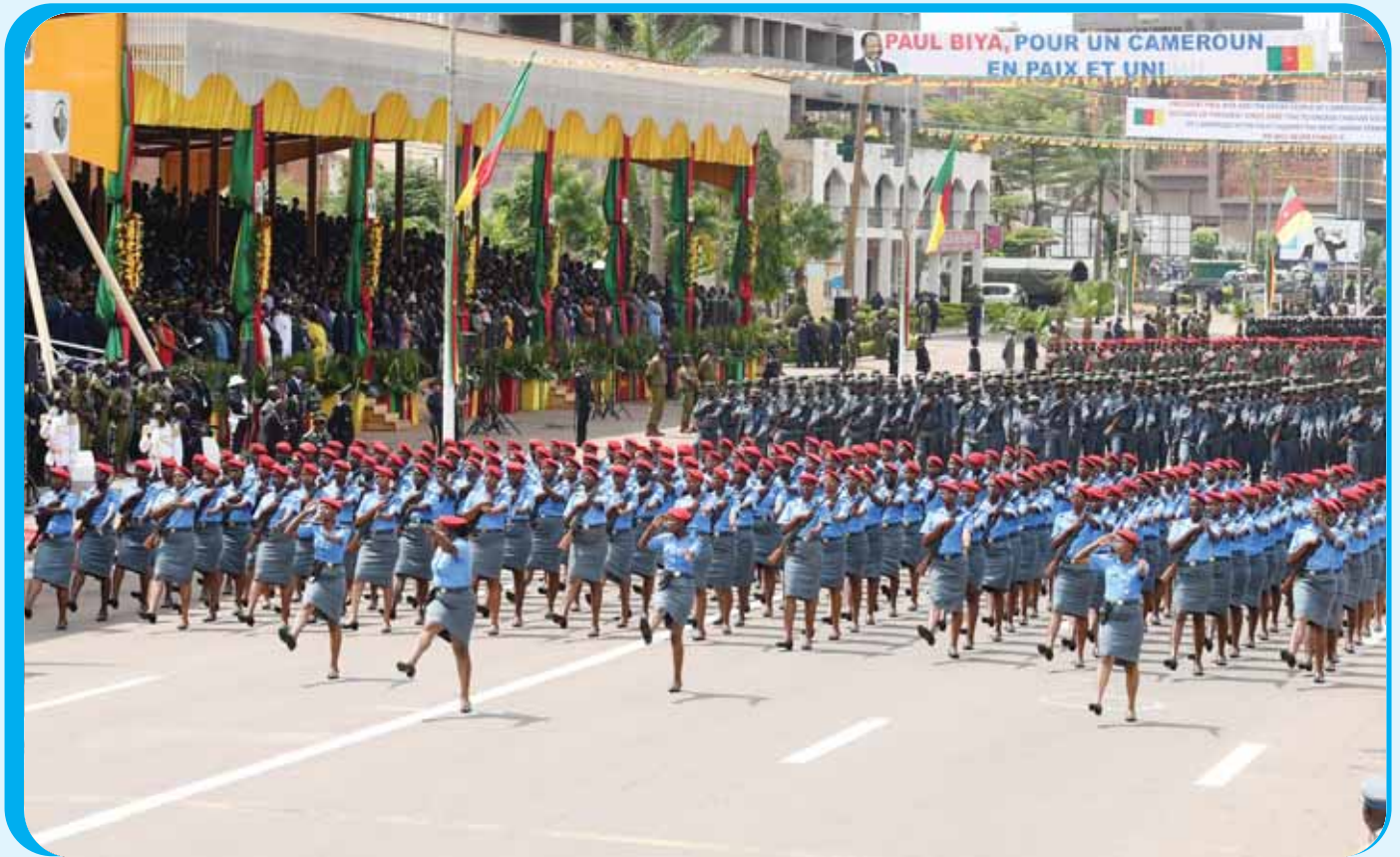
Elements of the National Gendarmerie in a well-coordinated show of force and discipline.