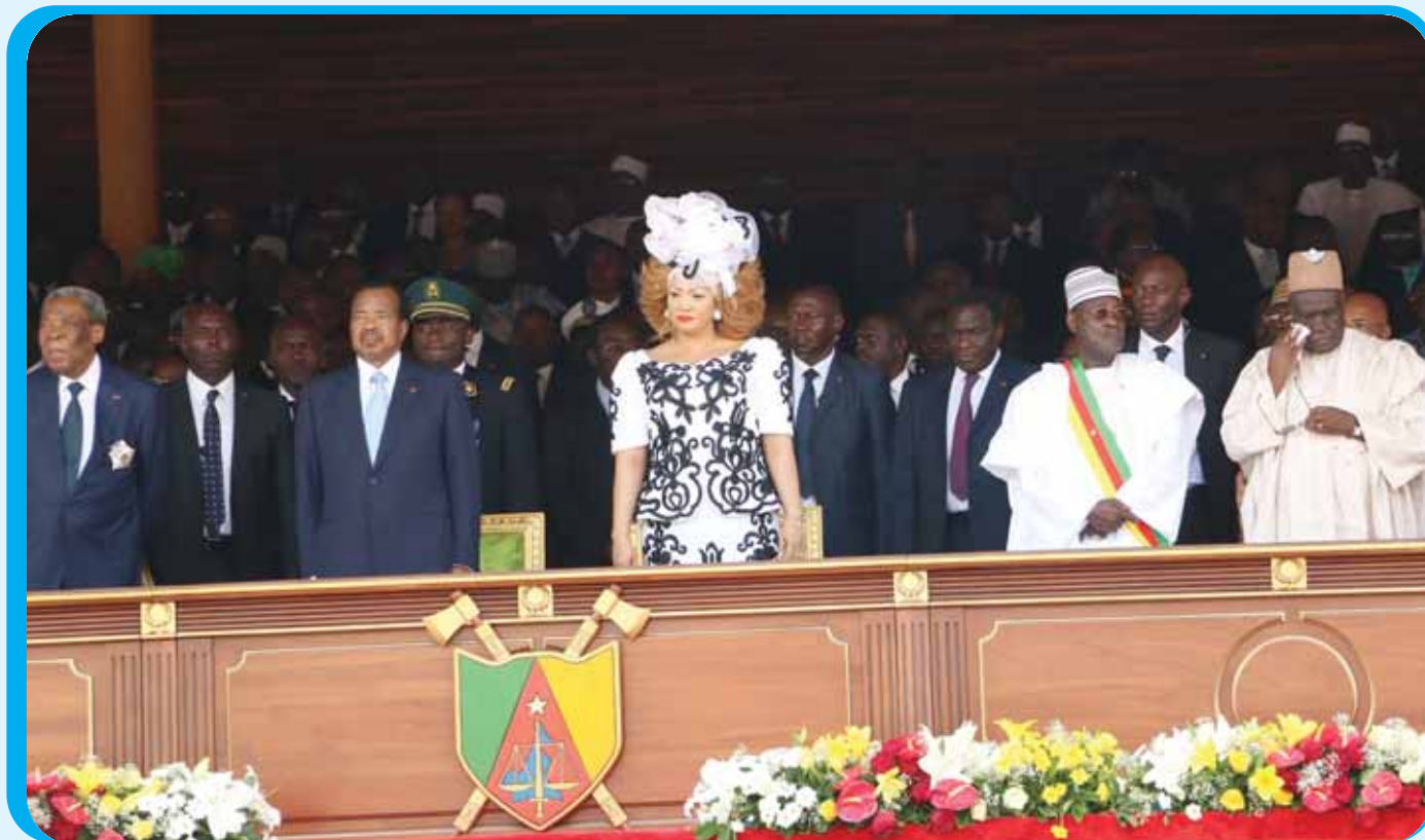
Comme il est de tradition, le Président de la République, Chef des Armées, S.E. Paul BIYA, a suivi debout le défilé des troupes.