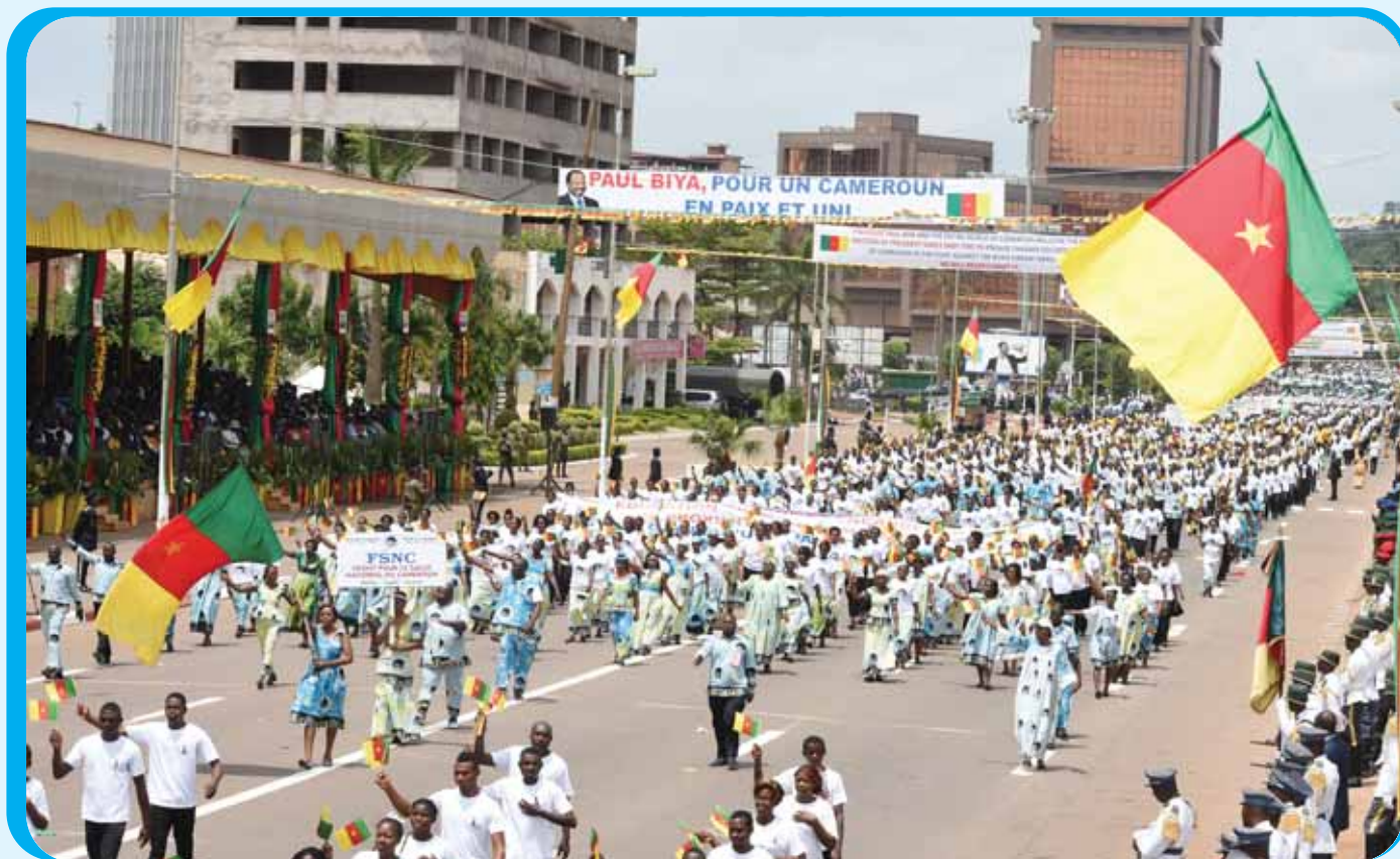
The presence of several other political parties testify to the maturity of our democracy.