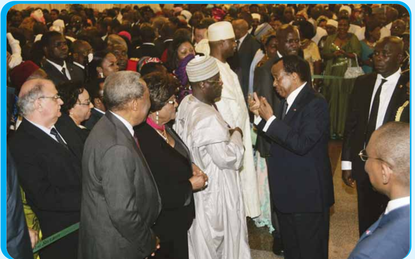
A chat here and there... with the Speaker of the National Assembly.