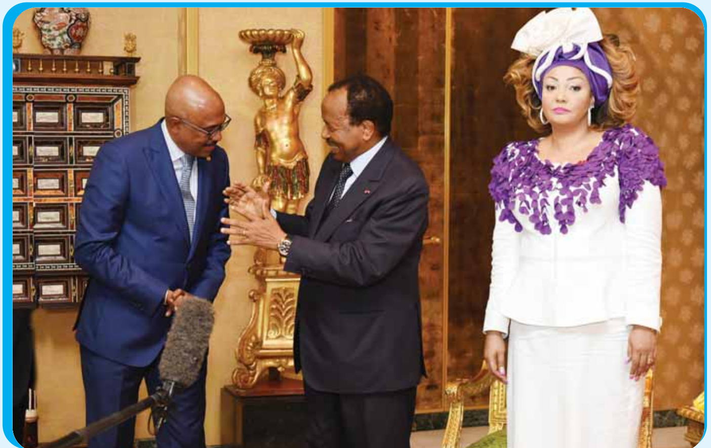
Le Chef de l'Etat réaffirmant au Directeur exécutif de l'ONUSIDA l'appui du Cameroun aux efforts de la communauté internationale pour vaincre le Sida.