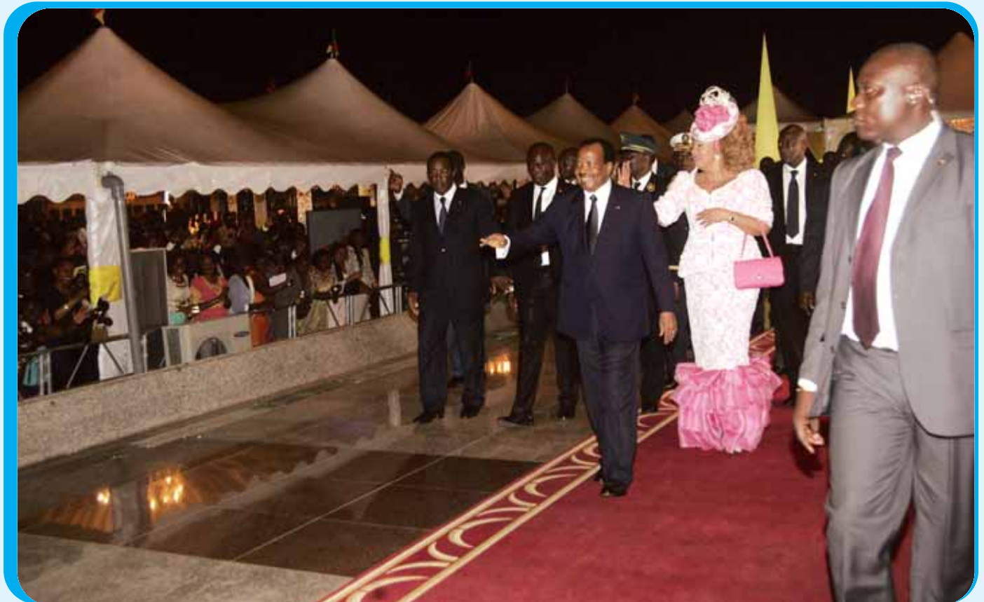
The Presidential Couple later greet invitees in the gardens of Unity Palace.