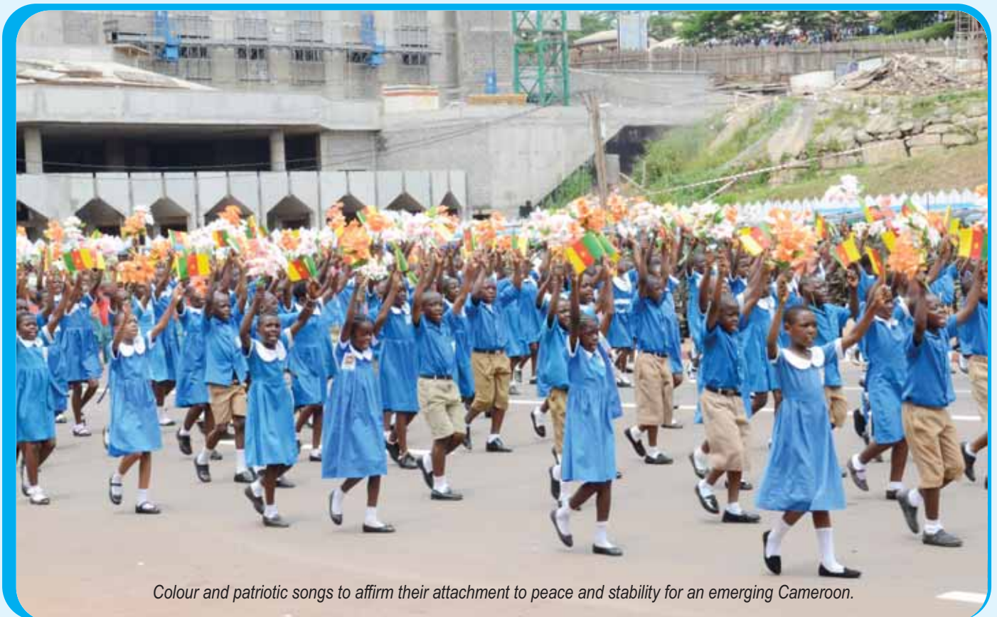
Colour and patriotic songs to affirm their attachment to peace and stability for an emerging Cameroon.