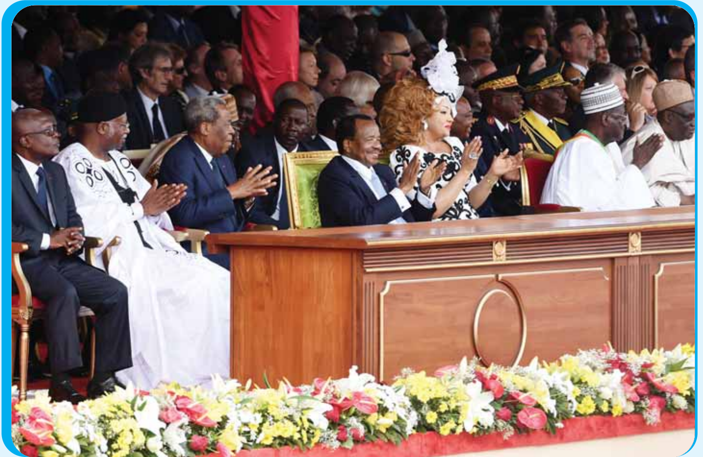
The ruling CPDM party rose up to the challenge as usual as they had a massive and orderly presentation.