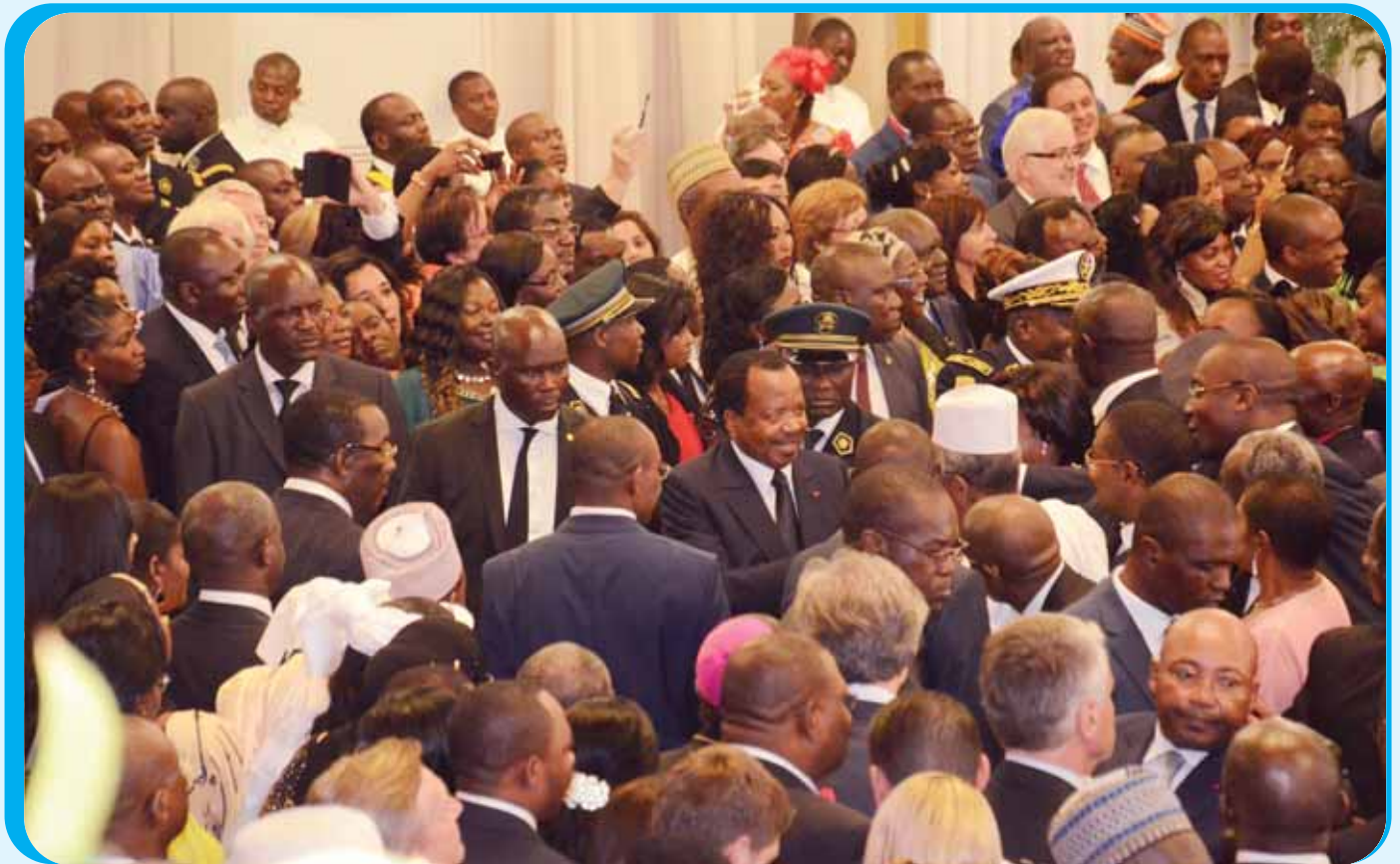
. President Paul BIYA and Madam Chantal BIYA greet invites to the reception offered by the Presidential Couple at Unity Palace.