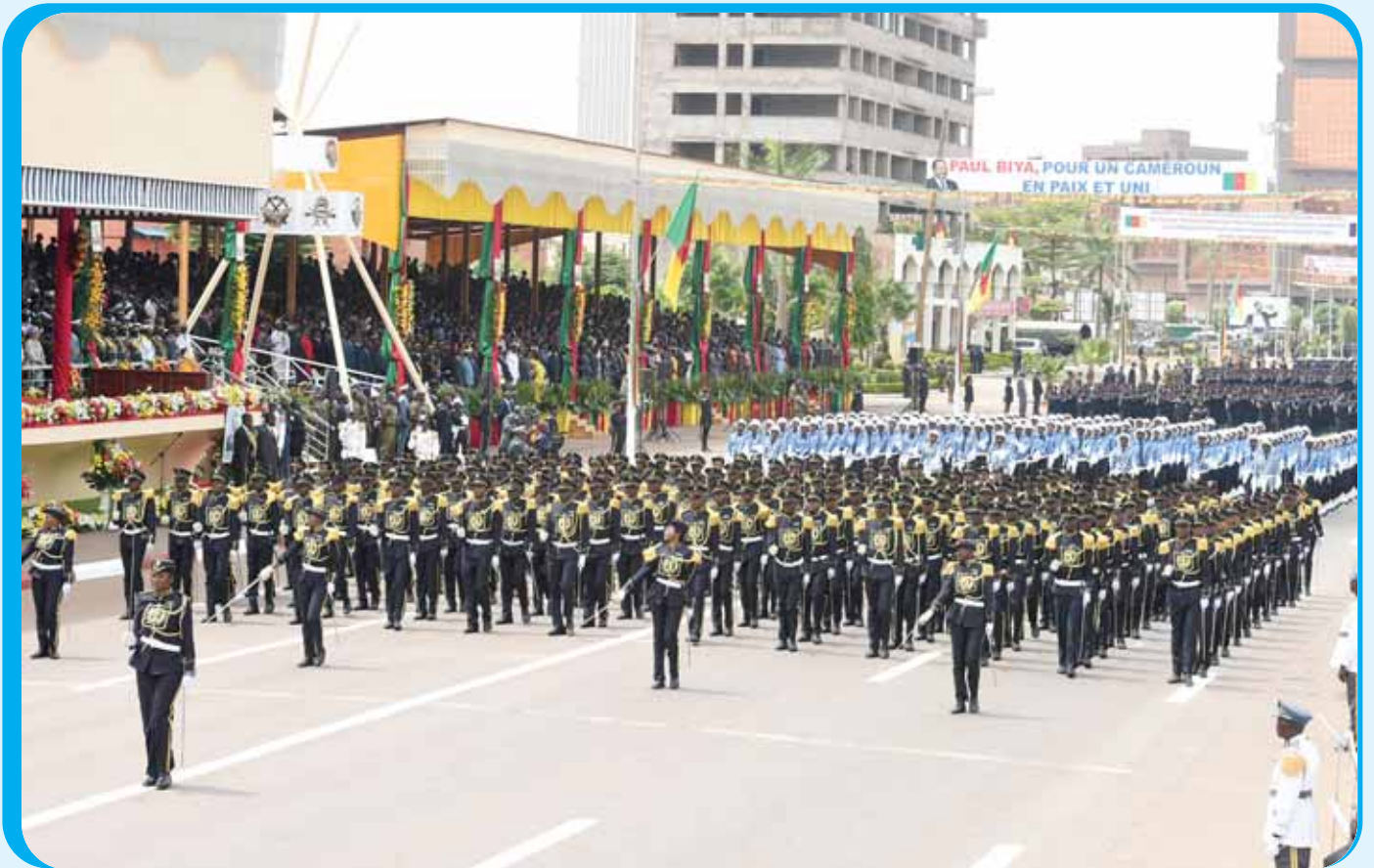
The Police also had impeccable dresses and their marching skills kept the public spellbound.