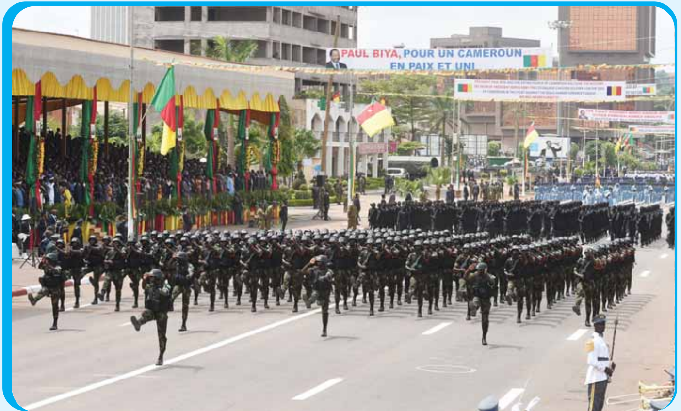
Une démonstration de force des autres composantes de nos forces de défense qui rassure.