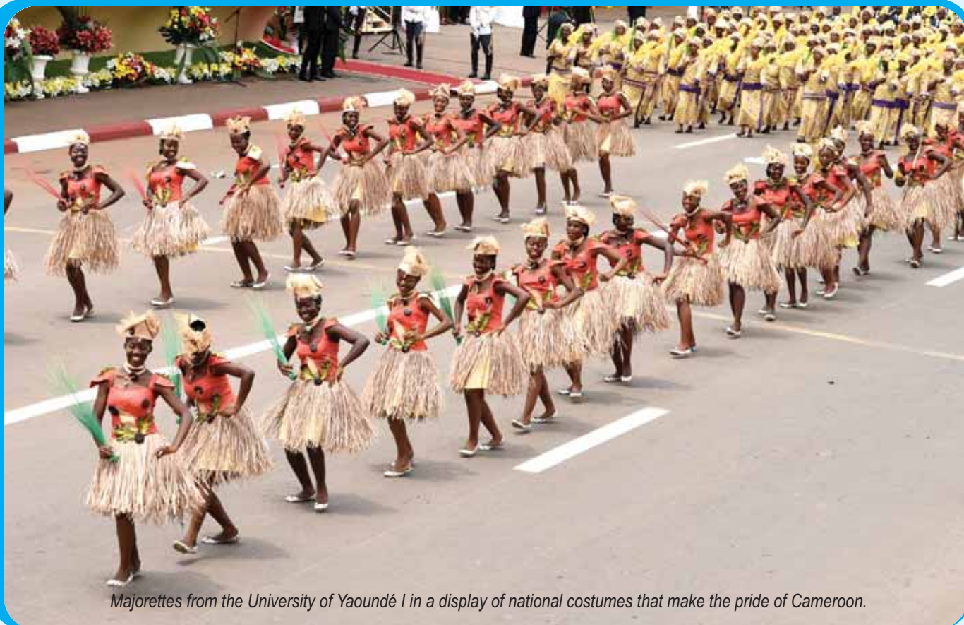
Majorettes from the University of Yaoundé I in a display of national costumes that make the pride of Cameroon.