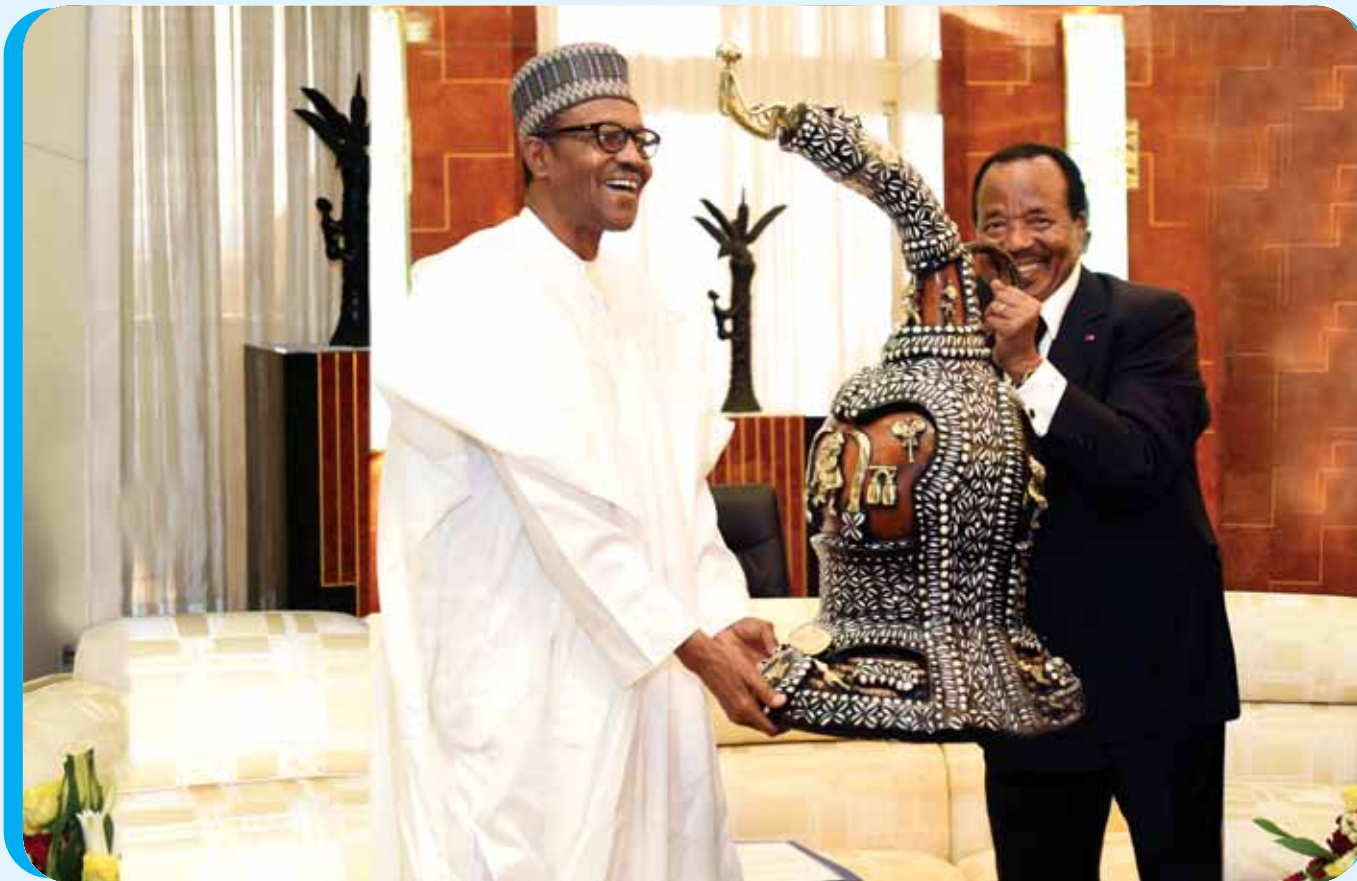
President BIYA offers a crafted calabash to his guest to seal their friendship.