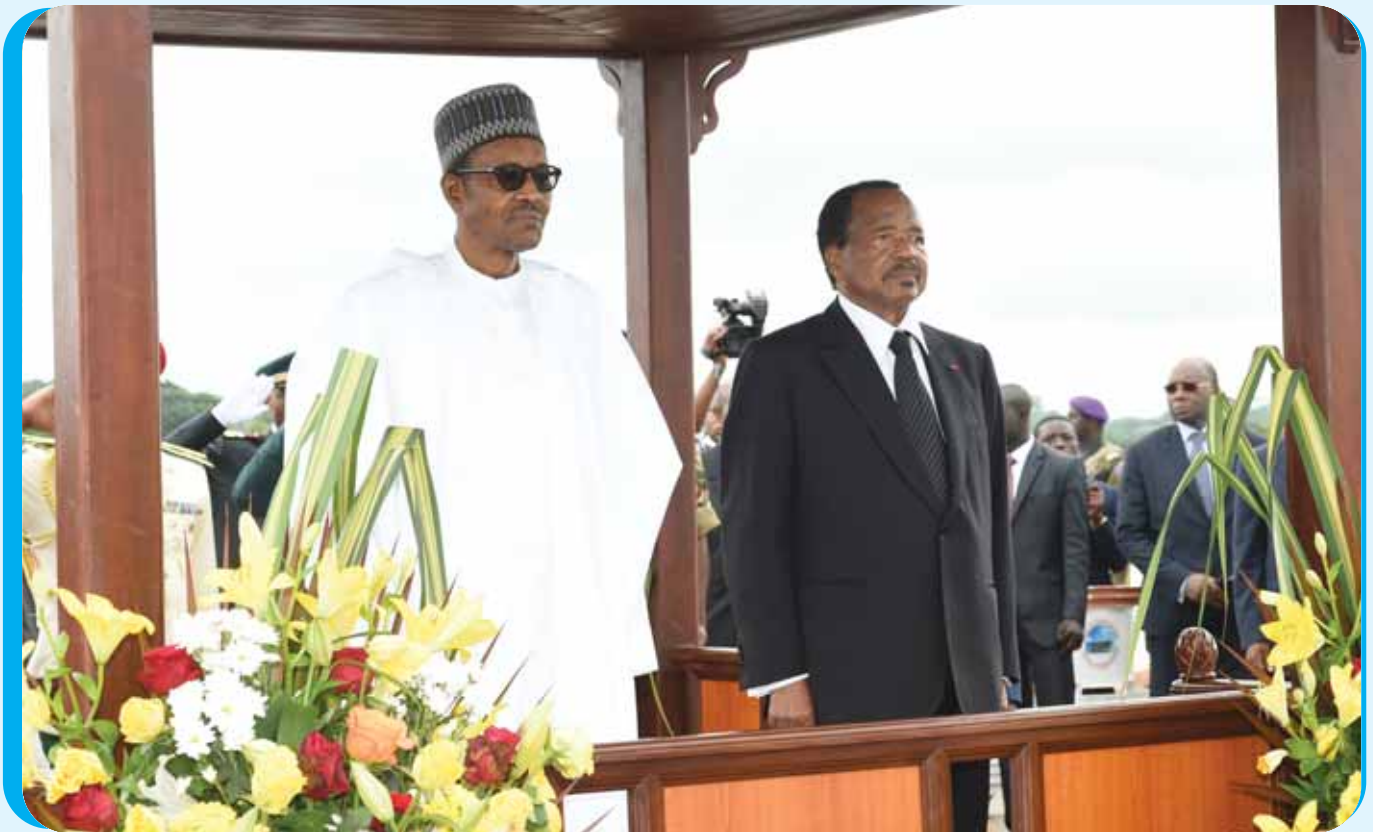
President BUHARI beside President Paul BIYA during the execution of the National Anthems of Nigeria and Cameroon.