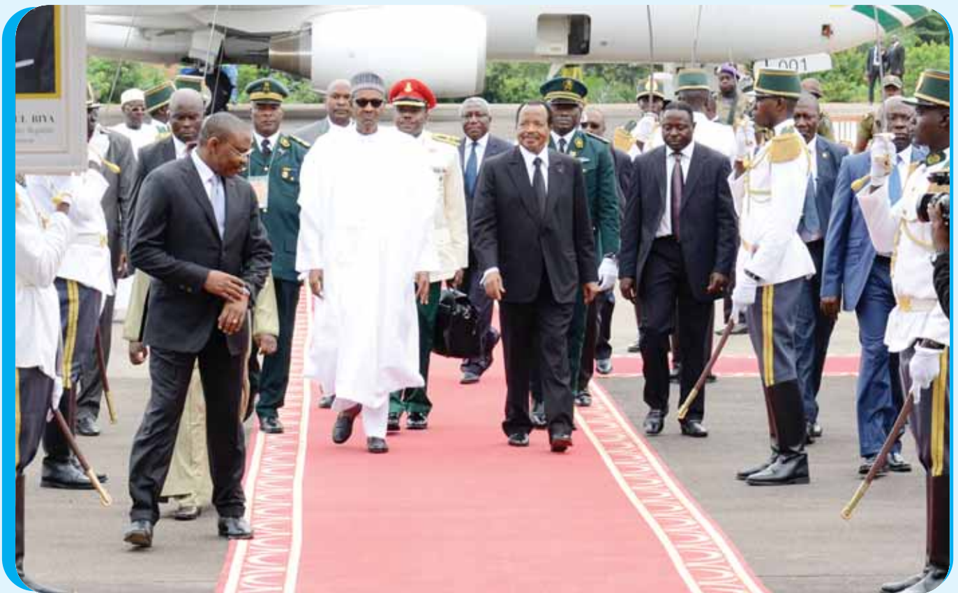
Après les formalités protocolaires, les deux Chefs d'Etat en direction du salon d'honneur de l'aéroport.