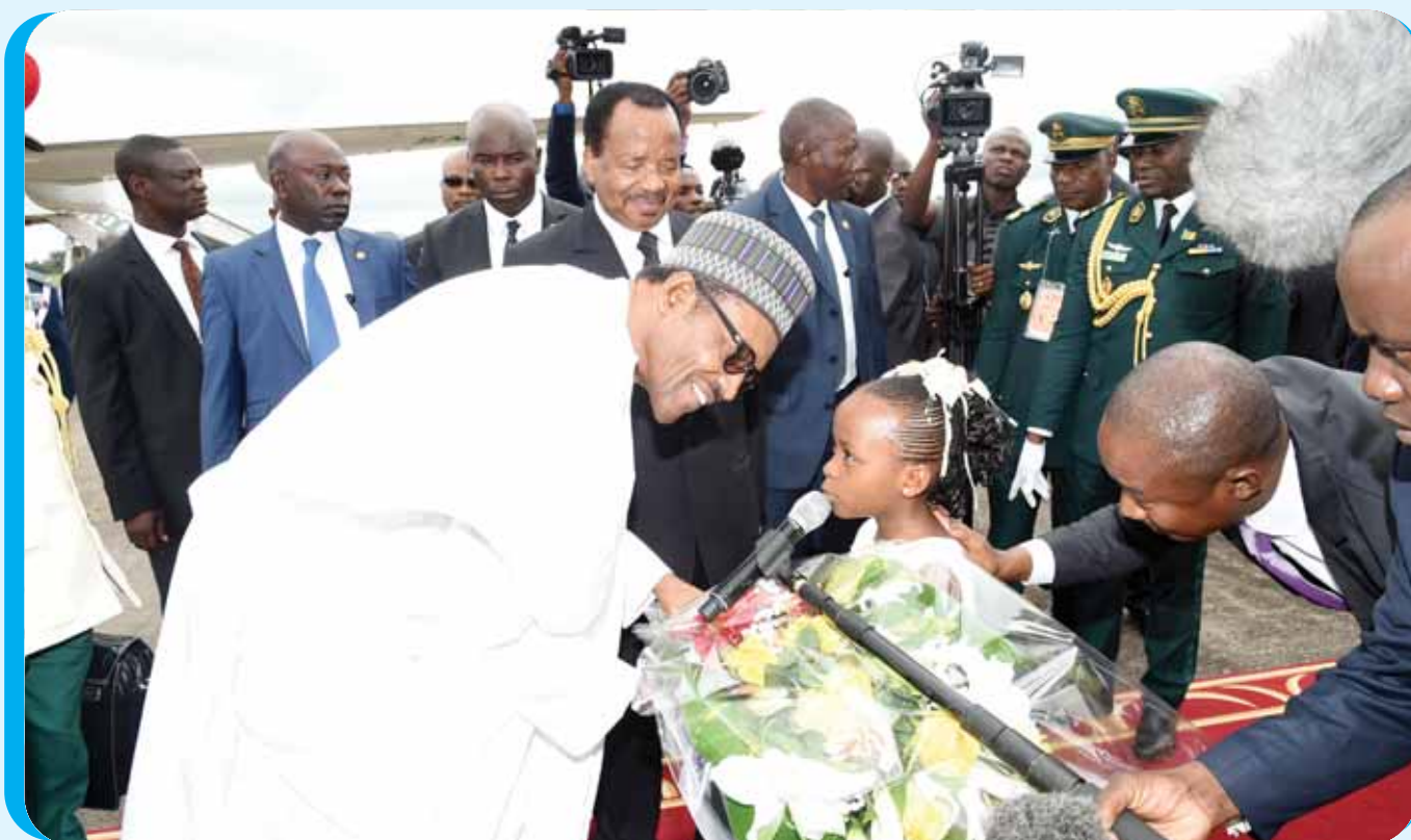
Mr President Muhammadu BUHARI, Welcome to Cameroon.