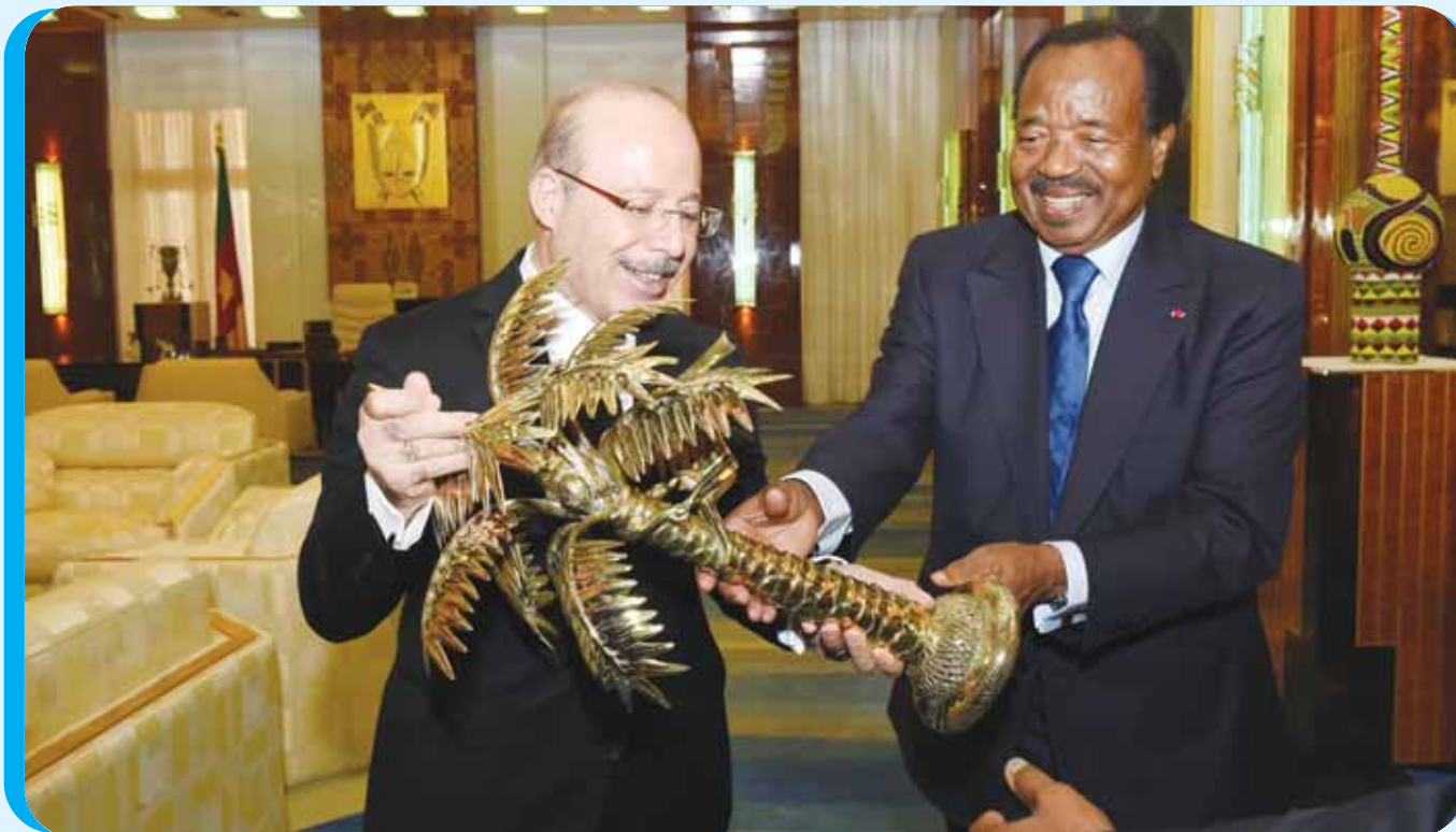
Le cadeau du Chef de l'Etat à l'Ambassadeur Faruk Dogan.