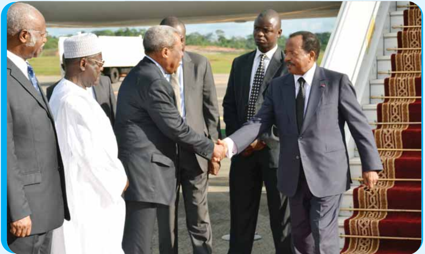
Le Chef de l'Etat accueilli au bas de la passerelle par les hautes personnalités de la République.

Après un court séjour privé en Europe, le Président de la République, qu'accompagnait son épouse, Mme Chantal BIYA, a regagné le Cameroun, le 12 septembre 2015.