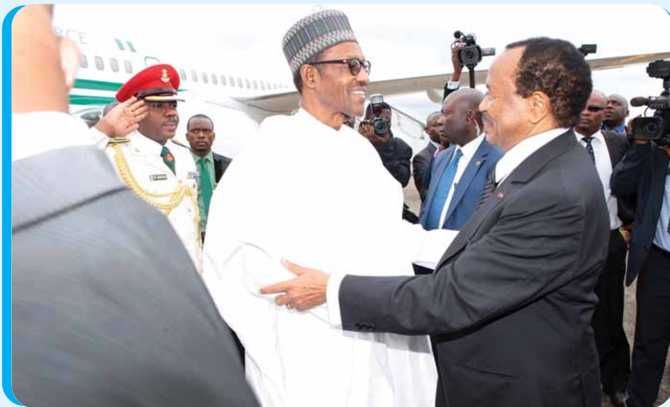
Accueil chaleureux par le Président Paul BIYA, à l'aéroport international de Yaoundé-Nsimalen, le 29 août 2015.