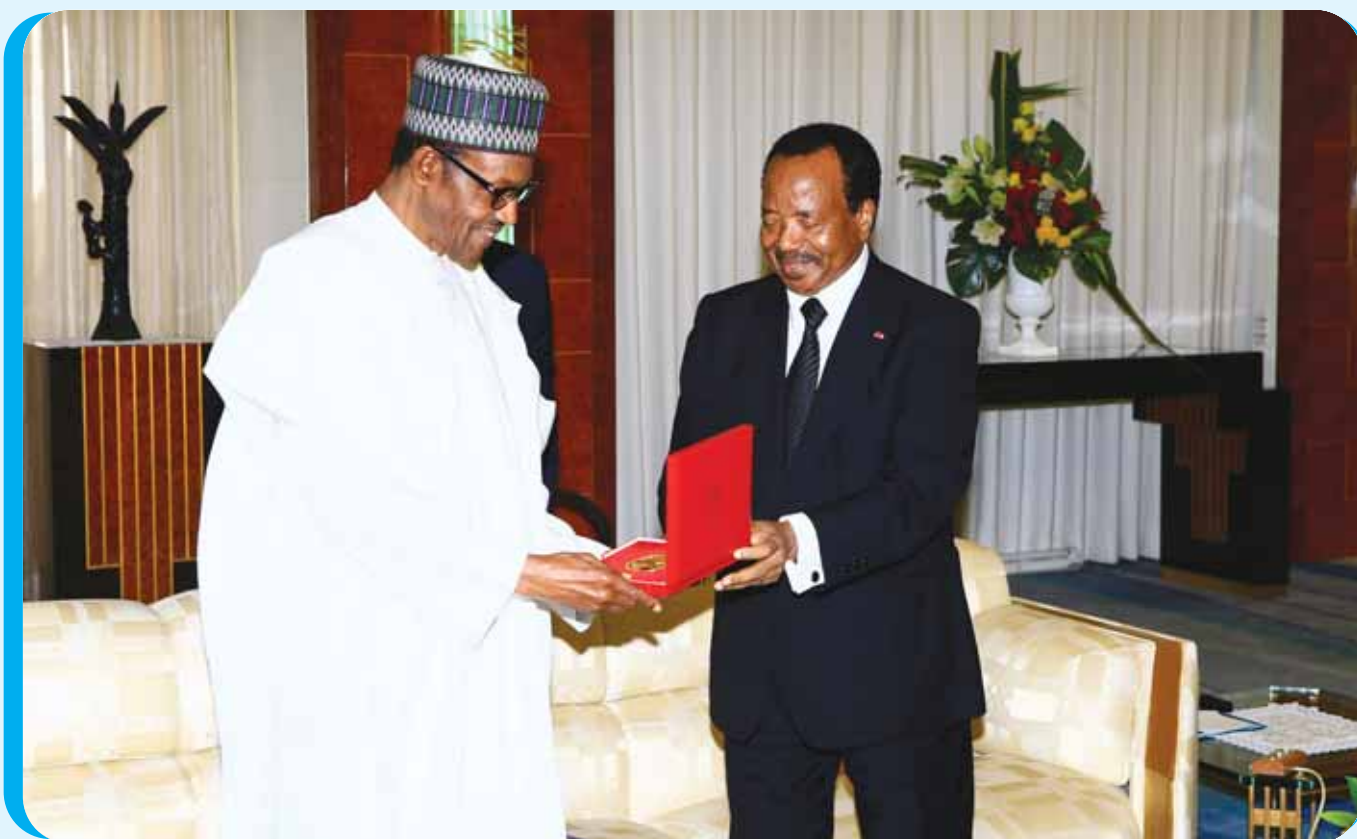
Le Chef de l'Etat a aussi offert la médaille des cinquantiennes de l'indépendance et de la réunification du Cameroun au Président BUHARI.