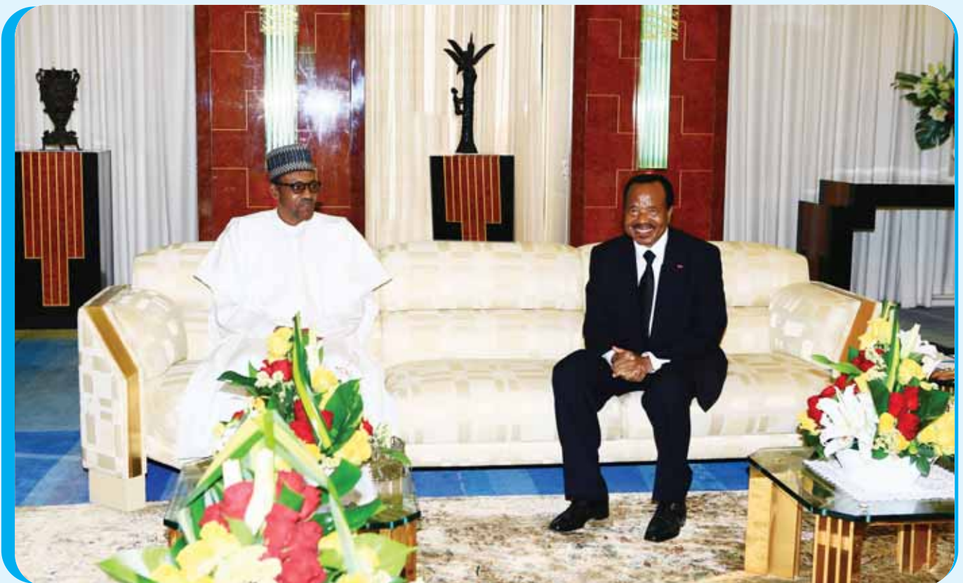
The two Heads of State sit down for serious discussions on issues of common interest to Cameroon and Nigeria.