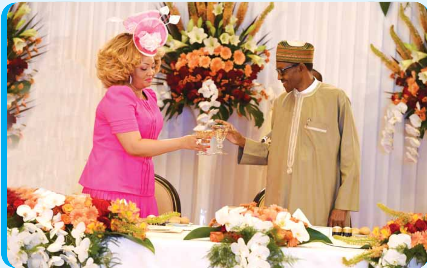
First Lady Mrs. Chantal BIYA in toast with President BUHARI.