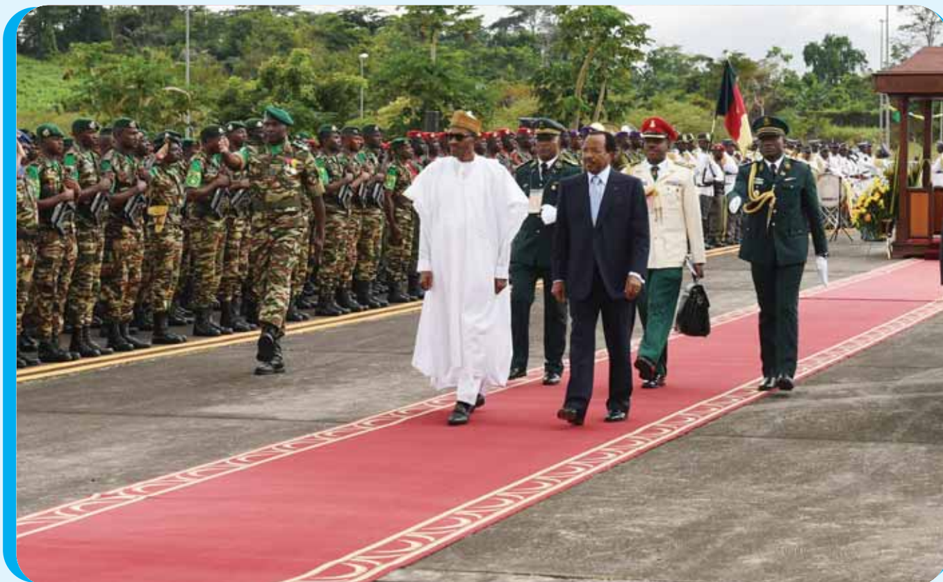
Review of troops to make farewell ceremony for President BUHARI.