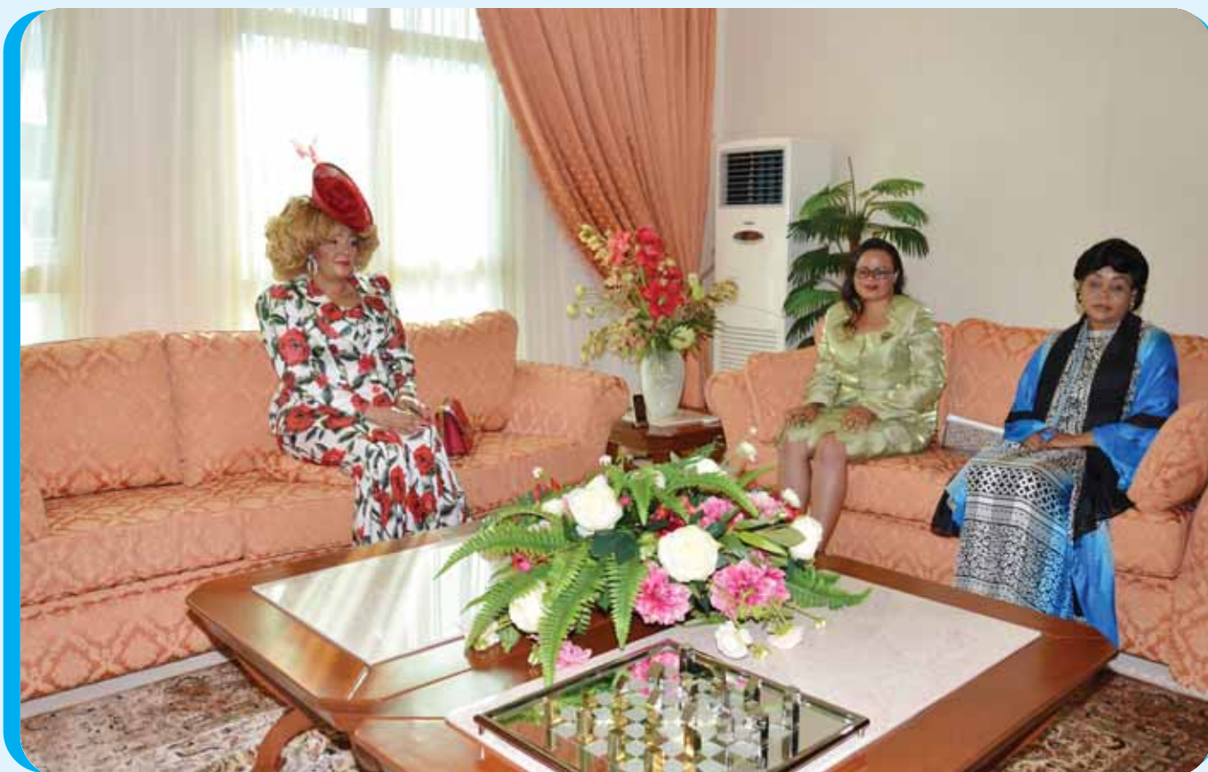
La Première Dame s'entretenant dans le salon d'honneur de l'aéroport avec quelques épouses des proches collaborateurs du Chef de l'Etat.