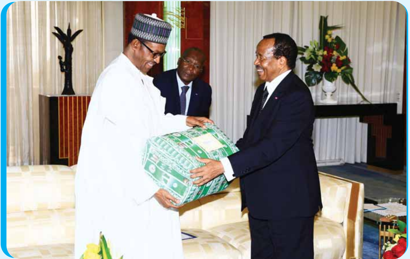
The Nigerian President also had a special gift for President Paul BIYA.