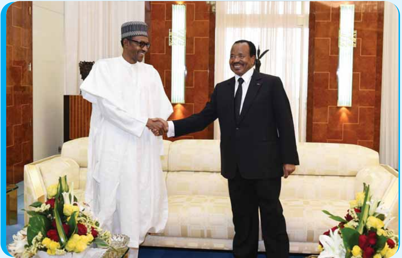
Poignée de main amicale entre les deux Chefs d'Etat avant leur entretien au sommet au Palais de l'Unité.