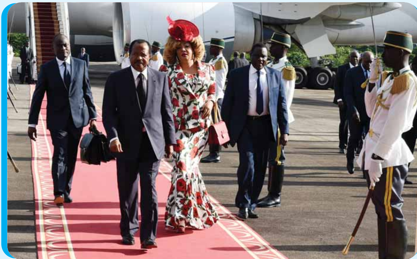
Le Président de la République et Madame Chantal BIYA, heureux de retrouver leurs compatriotes.