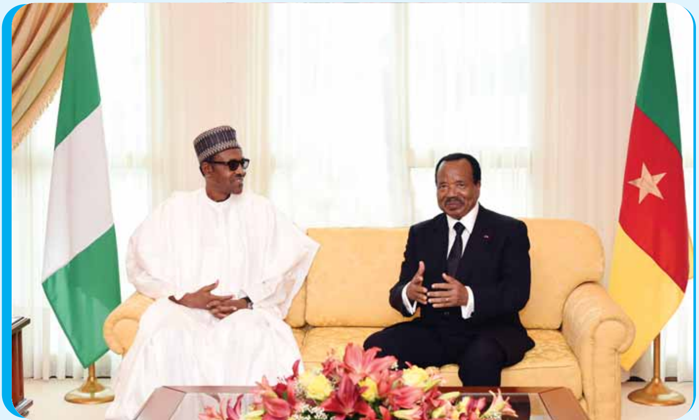
The initial intimate discussions between the two leaders at the Presidential Lounge.