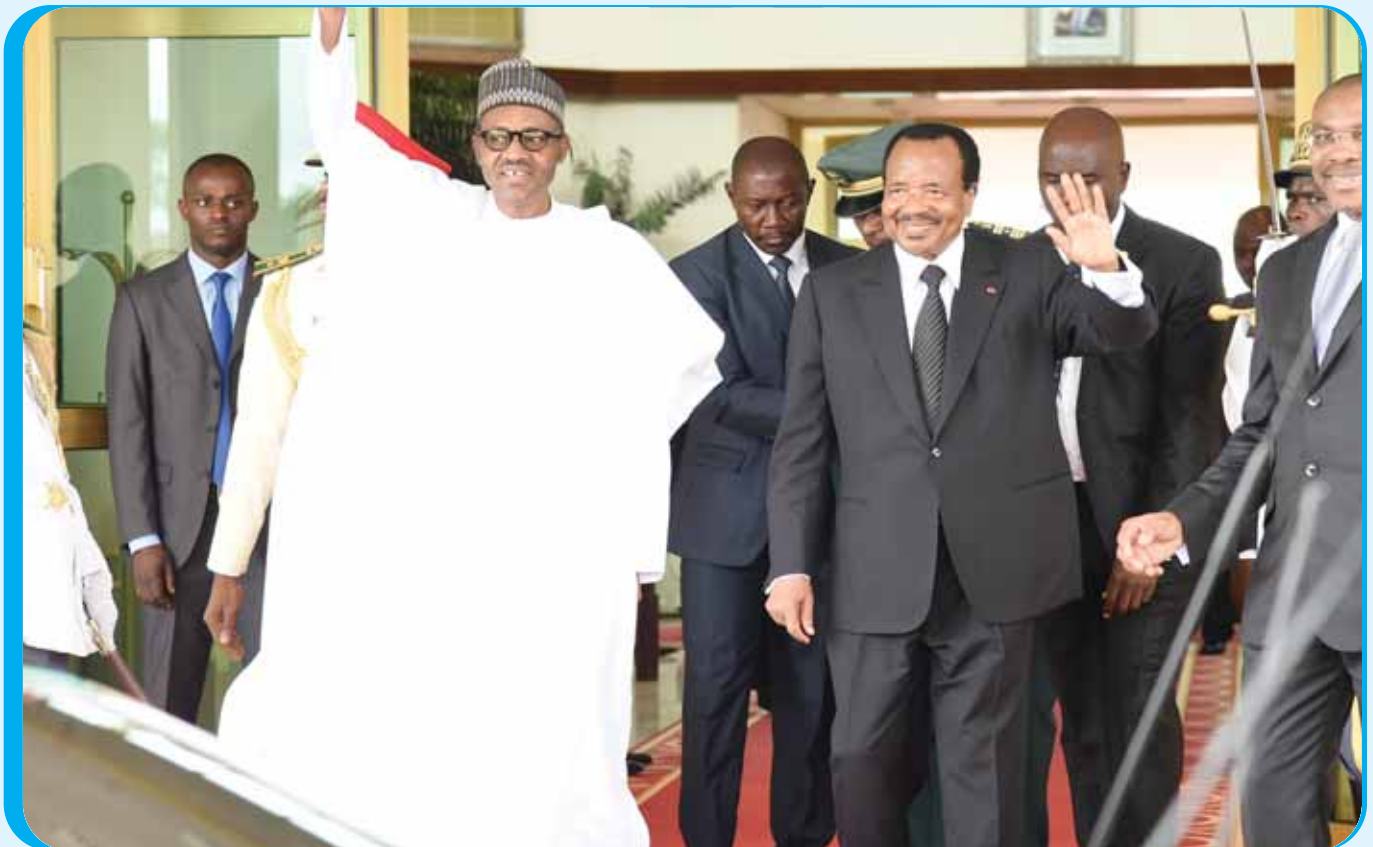
Le Président BUHARI et le Président BIYA répondant aux ovations de la foule venue accueillir l'hôte de marque du Cameroun.