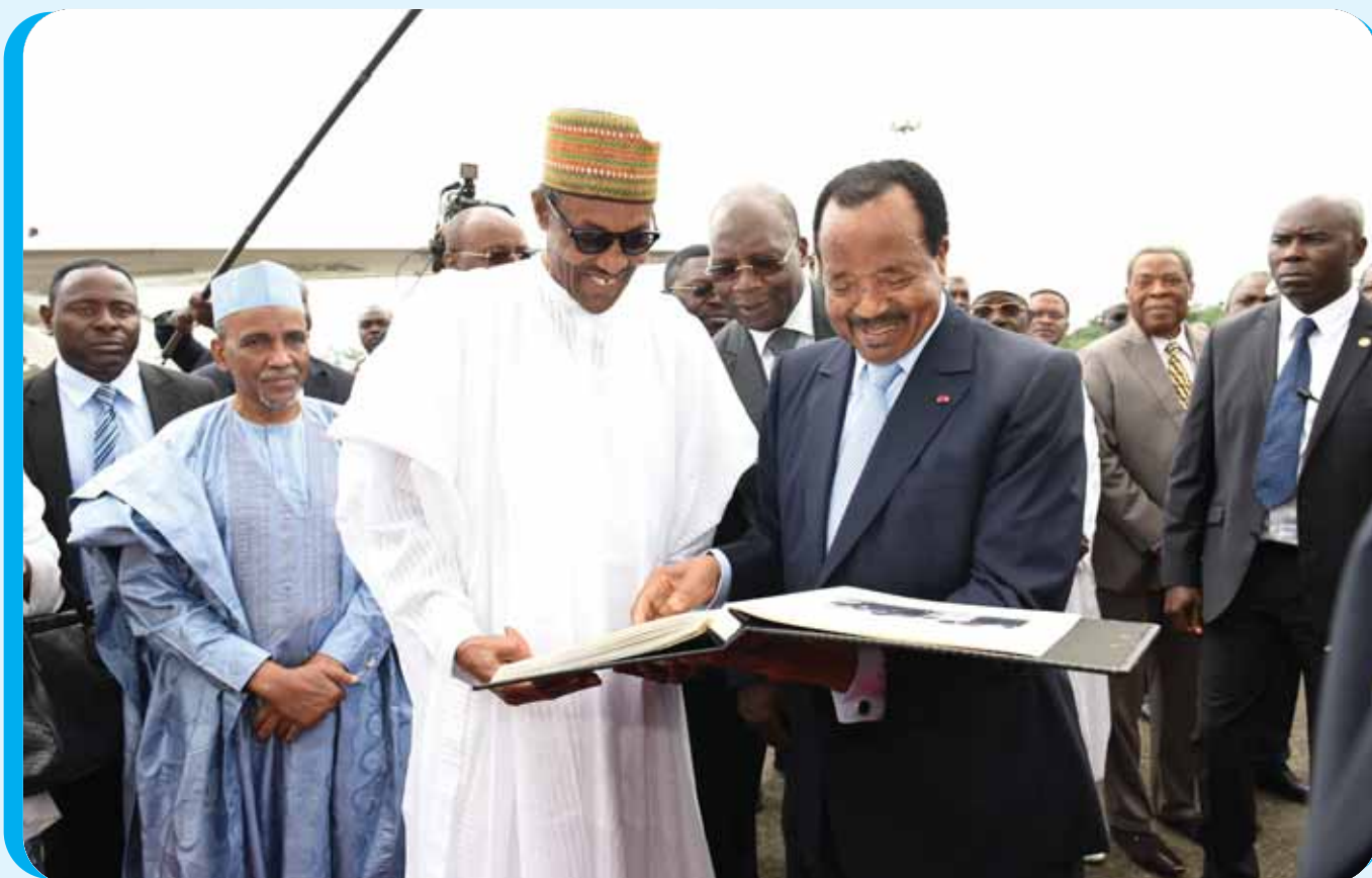
President Paul BIYA presents souvenir photo album to the visibly elated Nigerian Head of State.