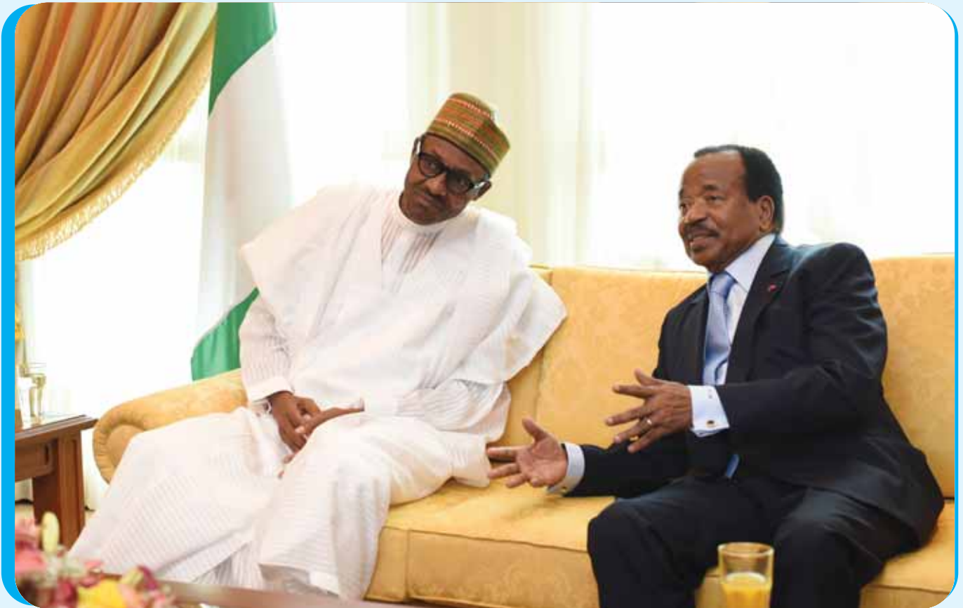
The two Heads of State continue their high level discussions.