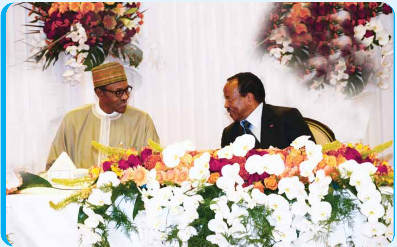
Amitié et fraternité entre les deux Chefs d'Etat lors du dîner d'Etat.