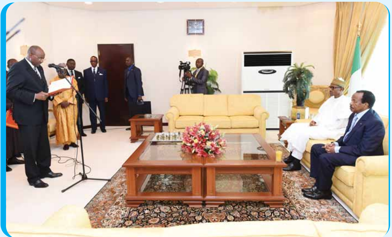
Lecture du communiqué conjoint par le Ministre camerounais des Relations Extérieures, Pierre Moukoko Mbonjo.